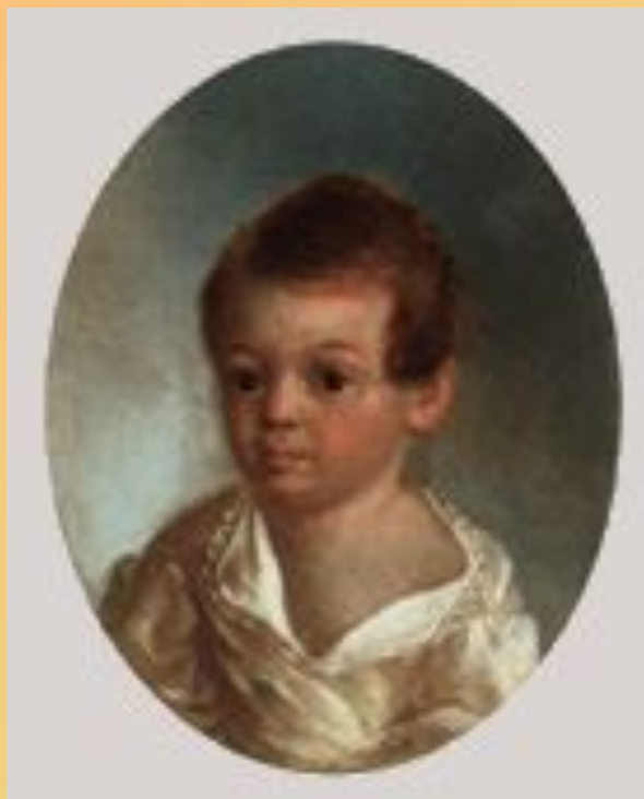
К. де Местр(?). Пушкин-ребенок. Метал. пласт., масло. 1801-1802. (ГМТ)

Детские годы Пушкина протекли в Москве и подмосковном селе Захарове.