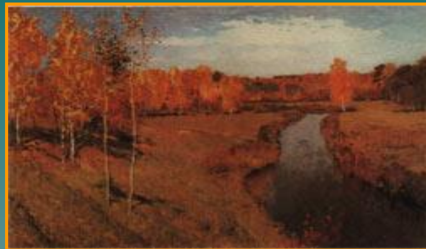
И. Левитан «Золотая осень»