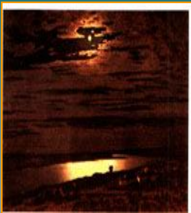
А.Куинджи «Лунная ночь на Днепре»