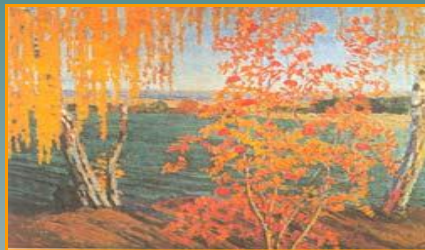
И. Грабарь «Рябинка»