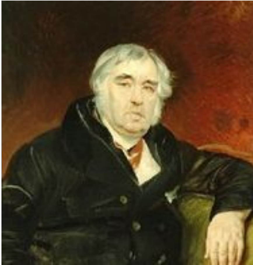
Иван Андрее вич Крылов (1769 - 1844)