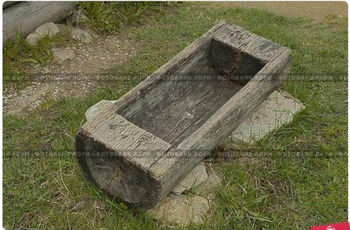
Деревенские мотивы. Старое пустое корыто