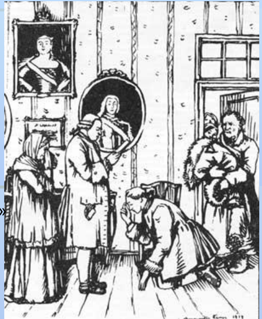
Иллюстрация к «Капитанской дочке» 1919