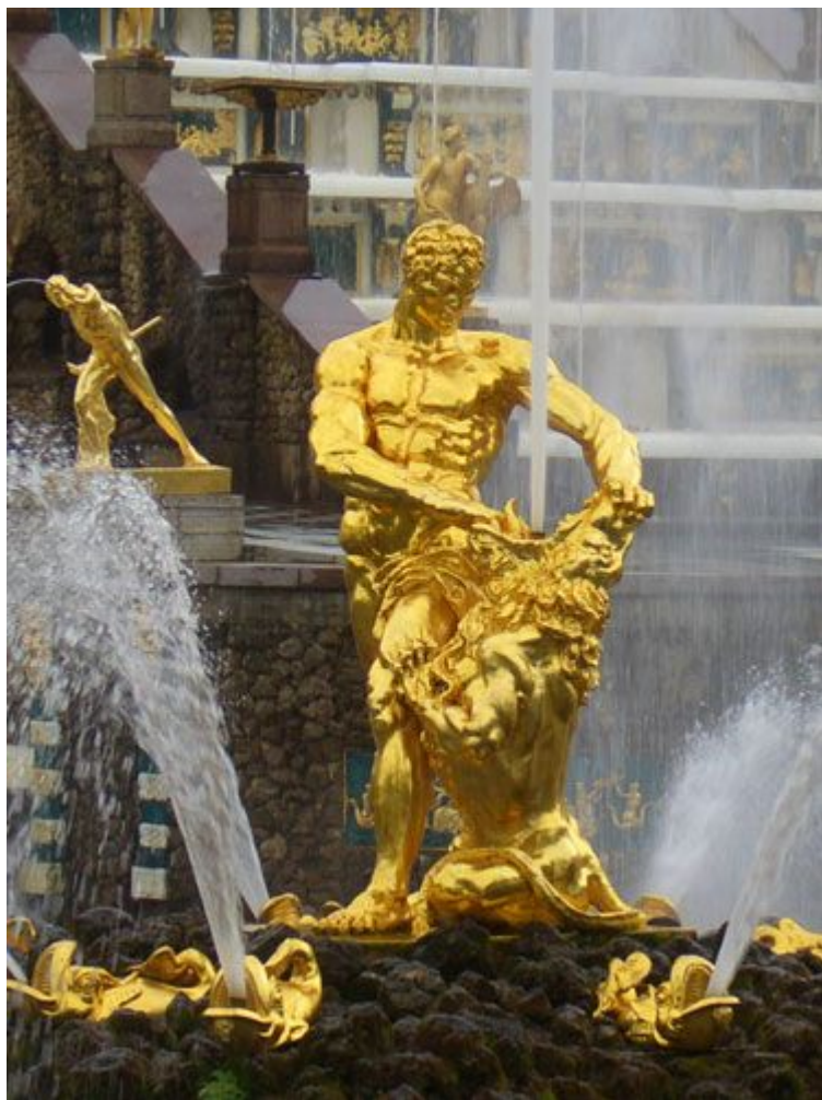
Золотая скульптура «Самсон»