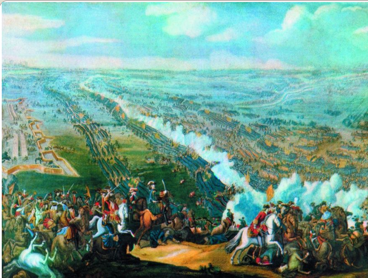
Художник А. Коцебу