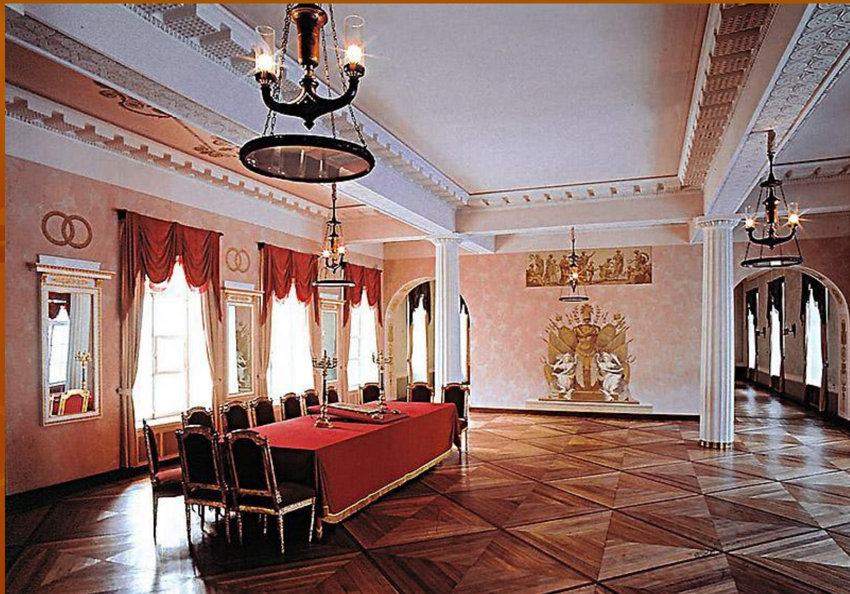
БОЛЬШОЙ ЗАЛ ЛИЦЕЯ