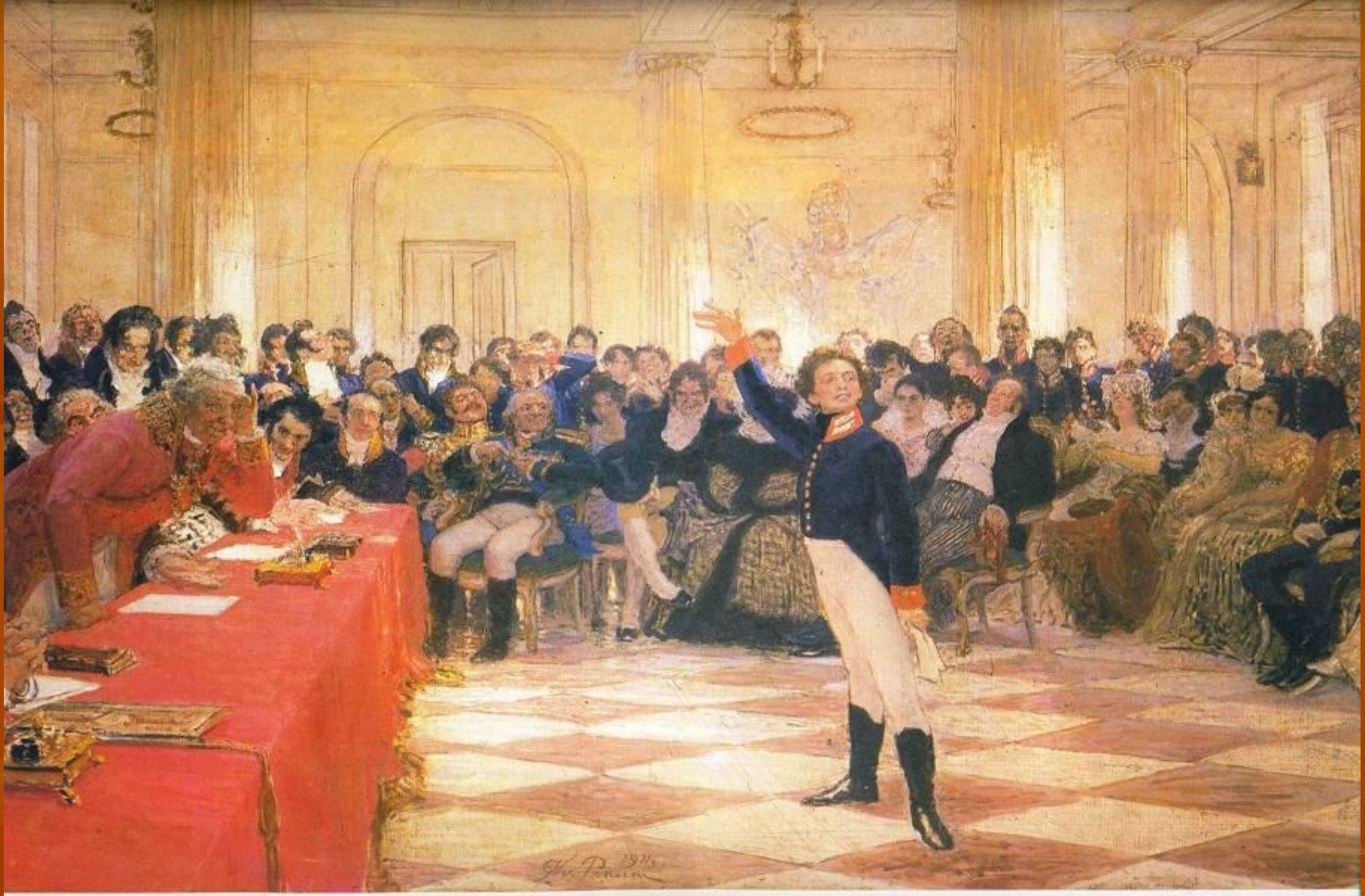
Пушкин на лицейском экзамене 8 января 1815 года