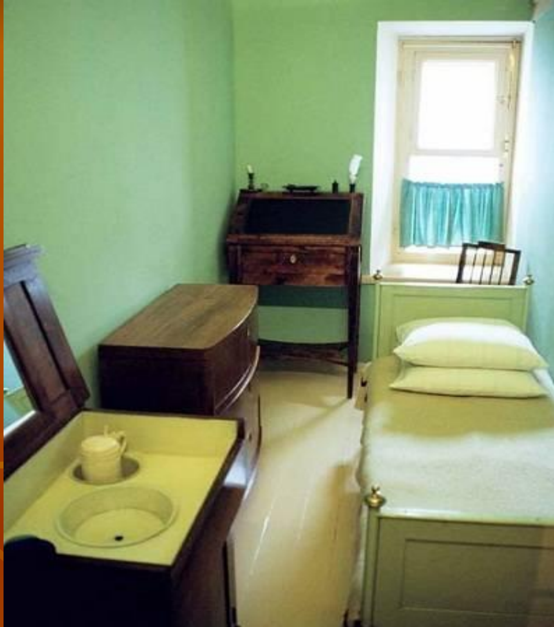
Комната №14. Здесь жил А.Пушкин