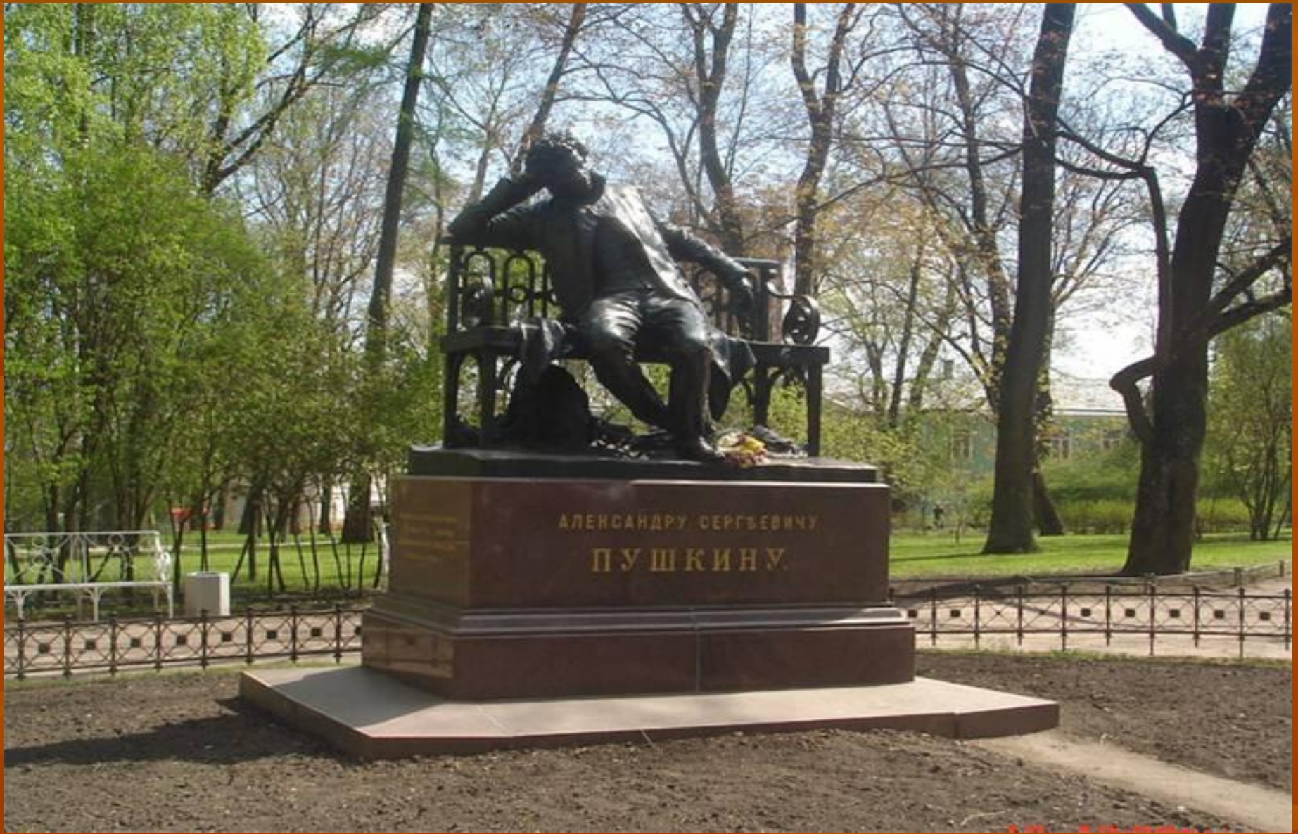
ПАМЯТНИК А.С.ПУШКИНУ В ЦАРСКОМ СЕЛЕ