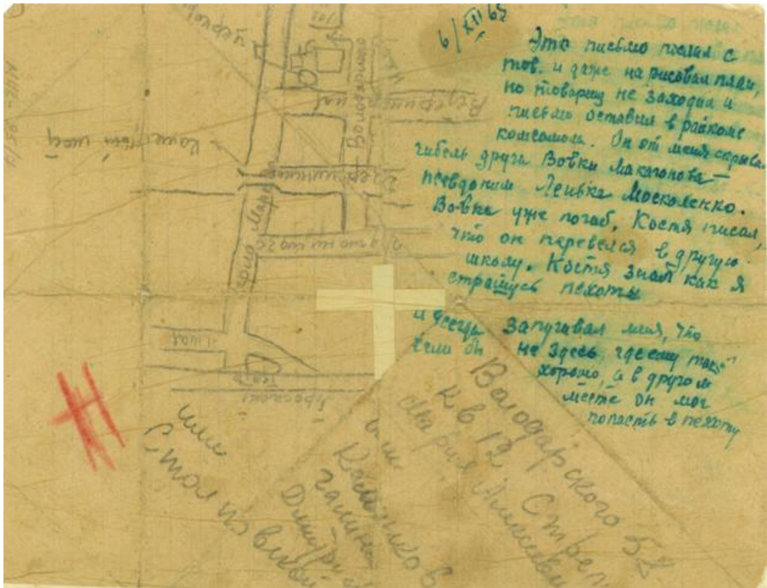
Ф. 289. Оп. 1. Д. 178. Л. 5 об.