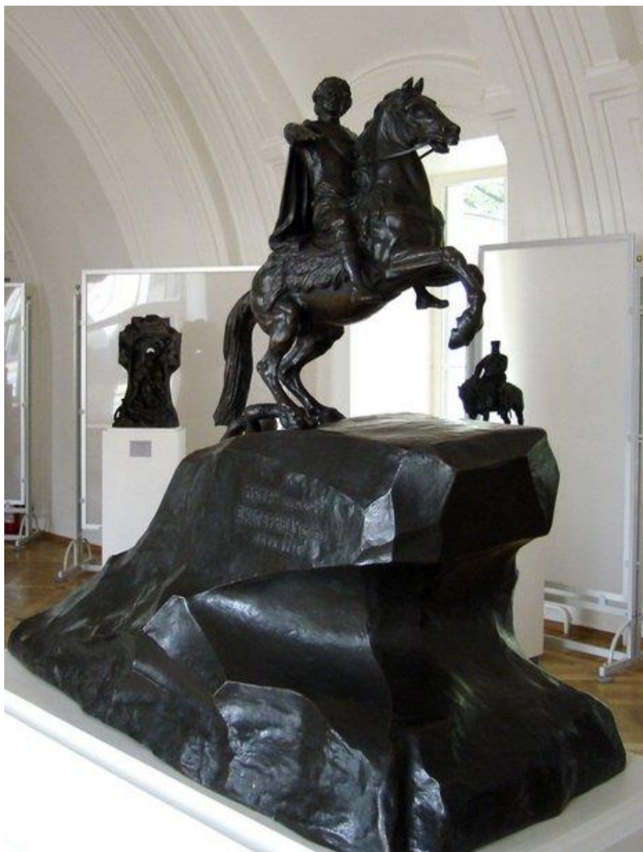
Модель «Медного всадника»