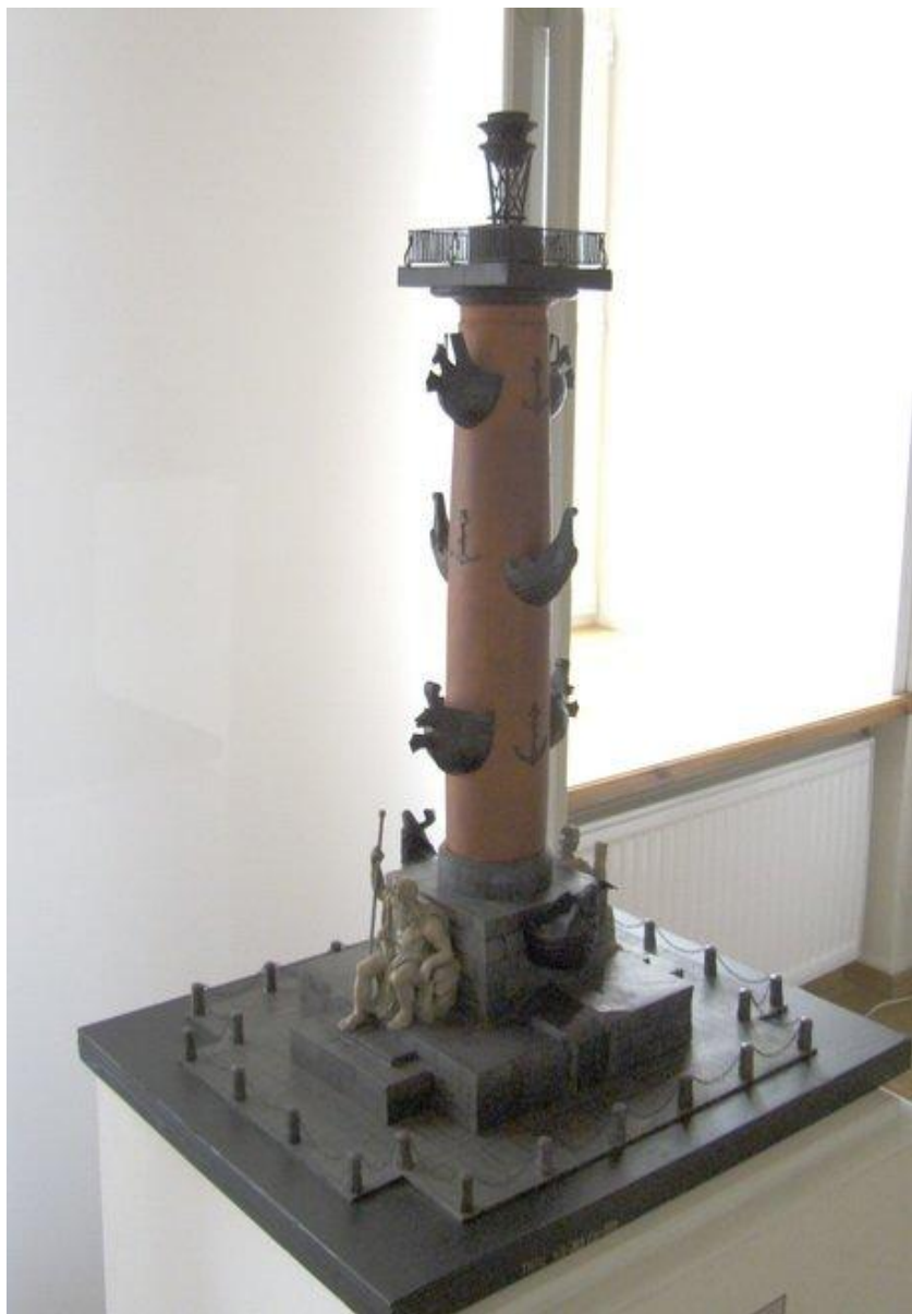
Модель Ростральных колонн на Стрелке Васильевского острова