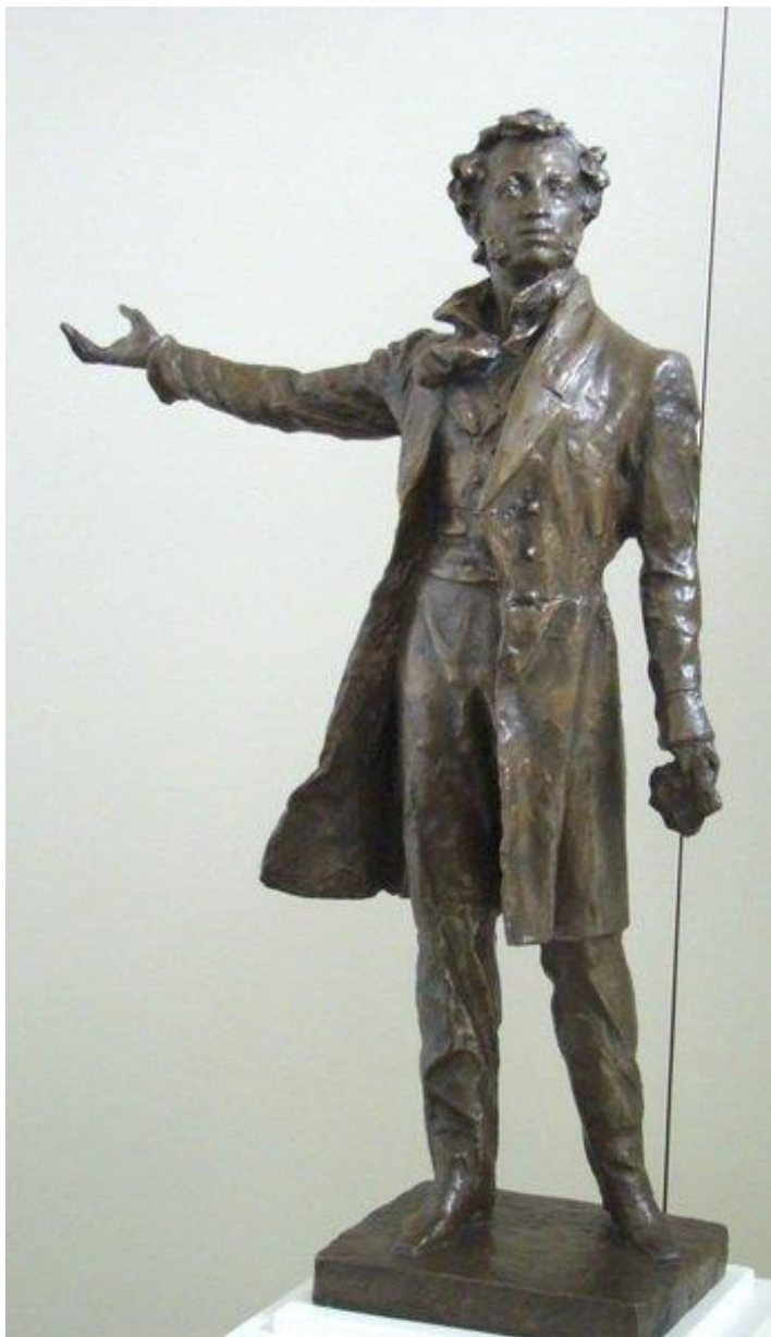
Модель памятника А.С. Пушкину