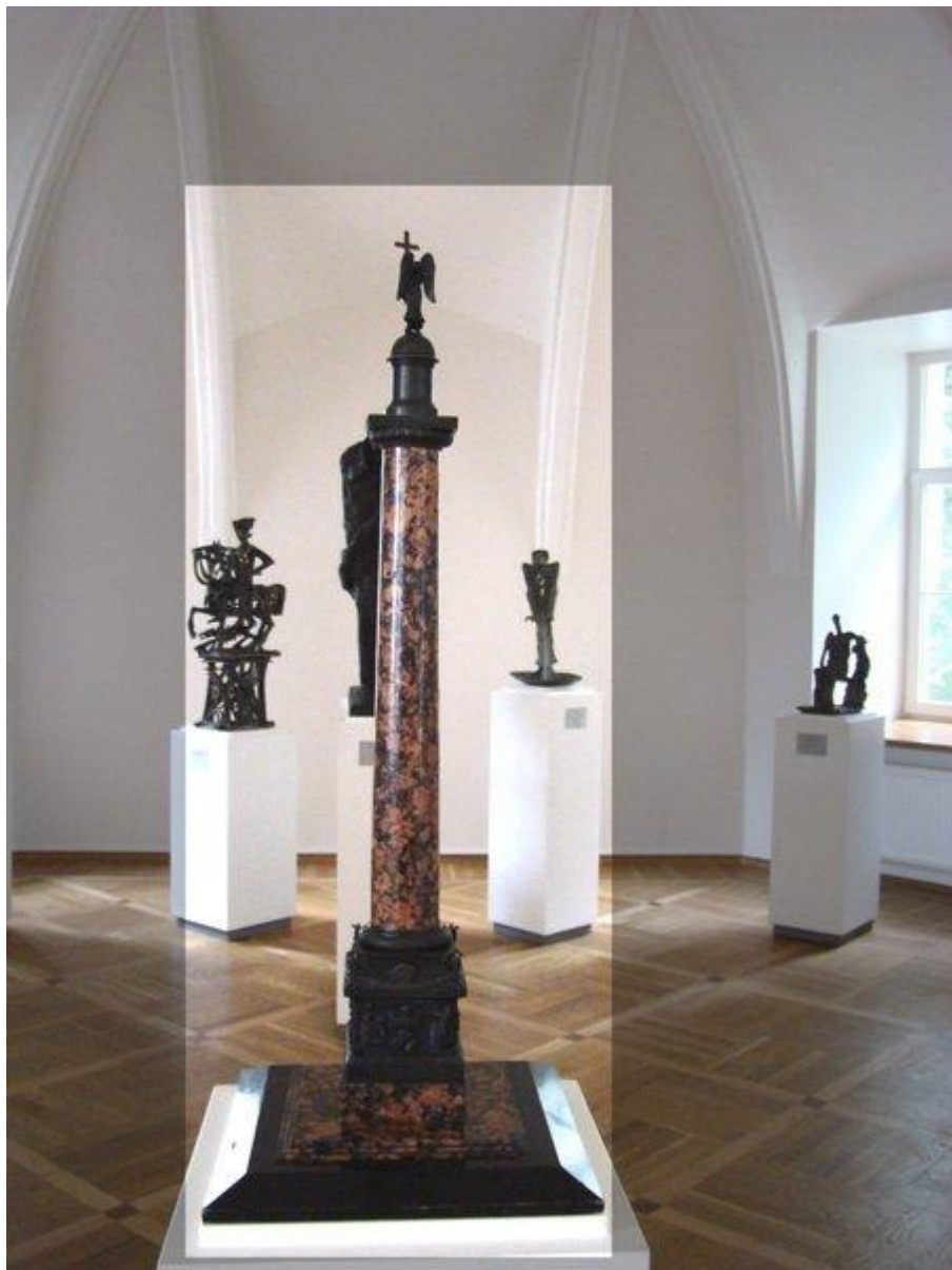
Модель Александровской колонны