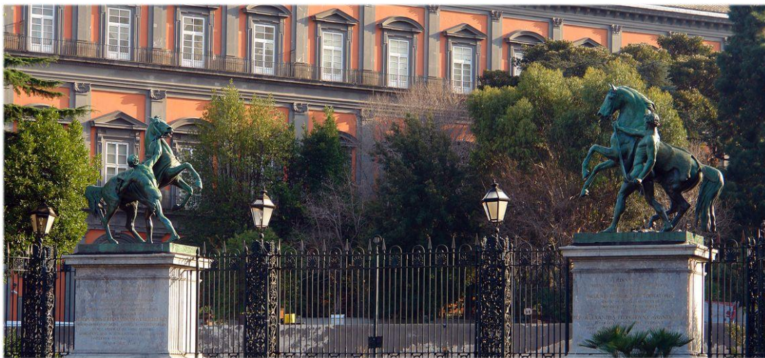
Кони Клодта в Неаполе