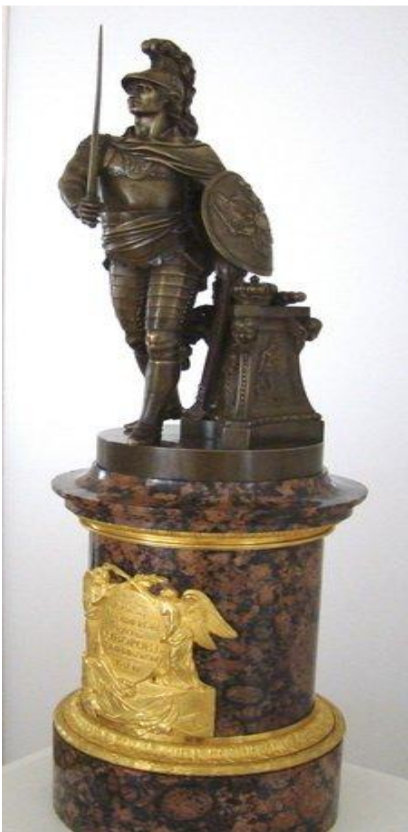
Модель памятника А.В.Суворову