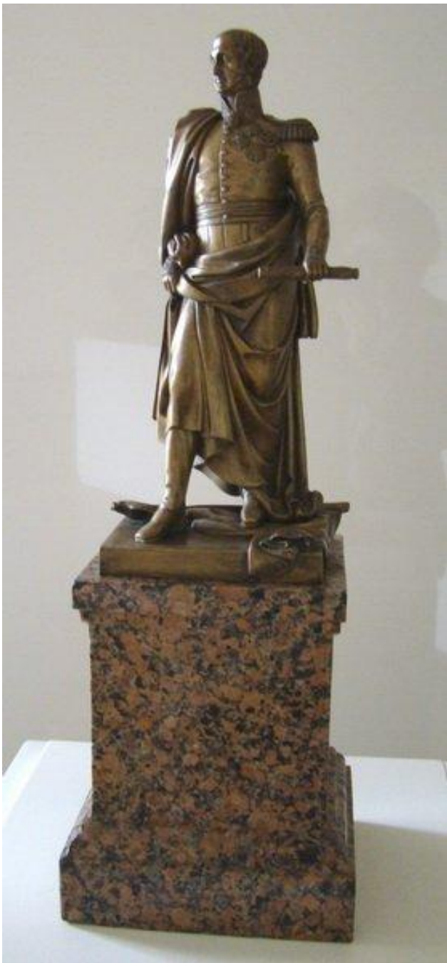
Модель памятника Барклаю де Толли