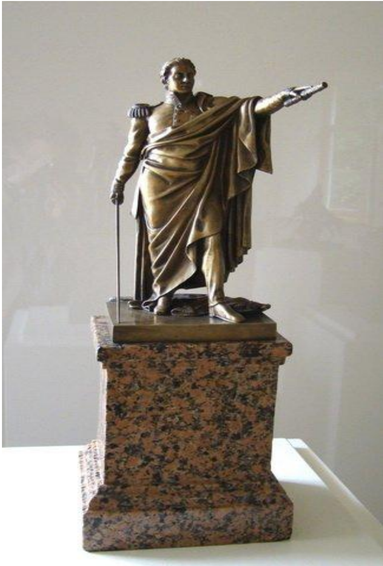
Модель памятника М.И. Кутузову у Казанского собора