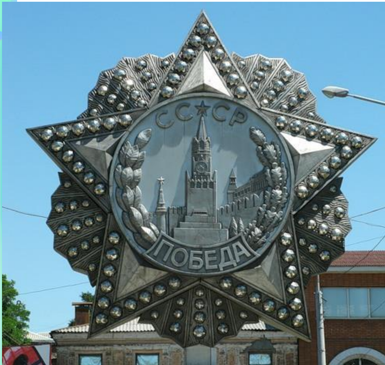
Площадь 5-го Донского казачьего корпуса