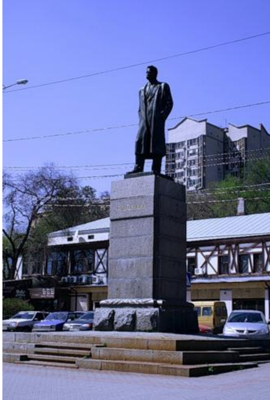
Писатель А.М. Горький