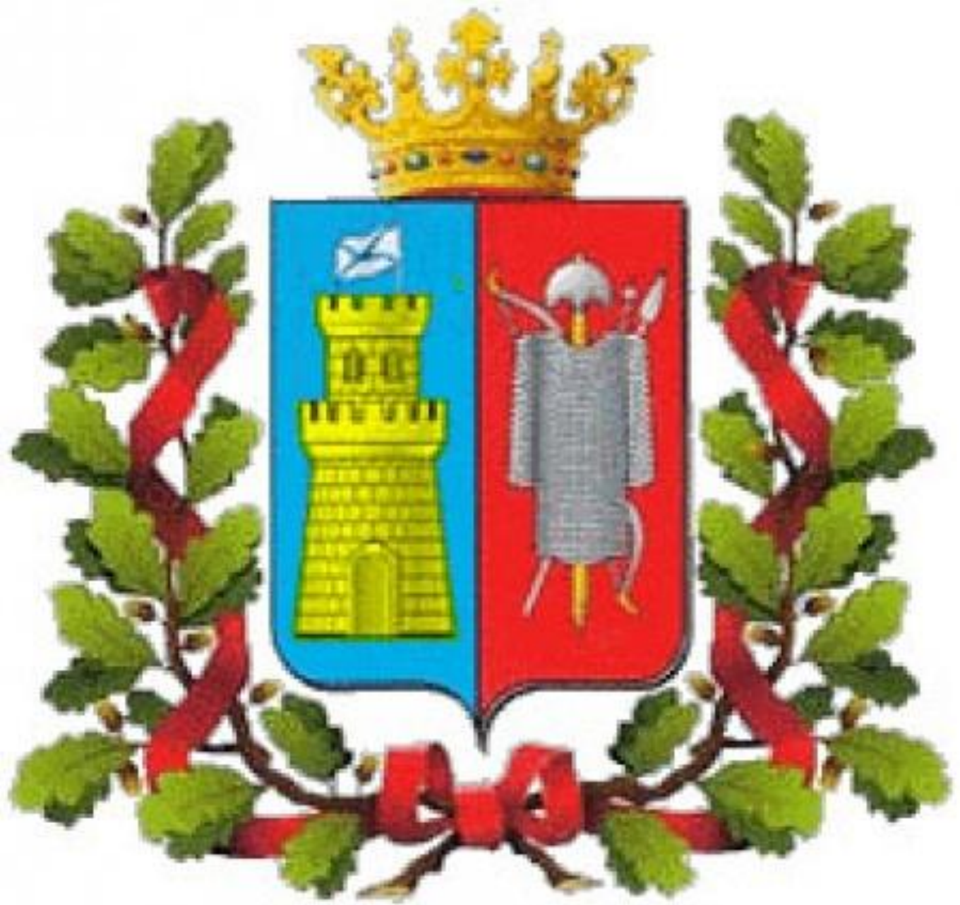
Герб города Ростова-на-Дону (1811 г.)