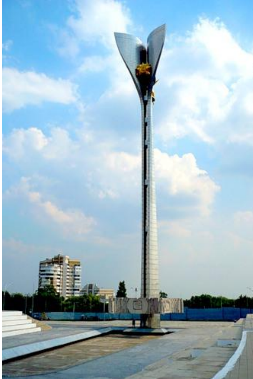
Стела воинам – освободителям г. Ростова-на-Дону от немецко-фашистских захватчиков