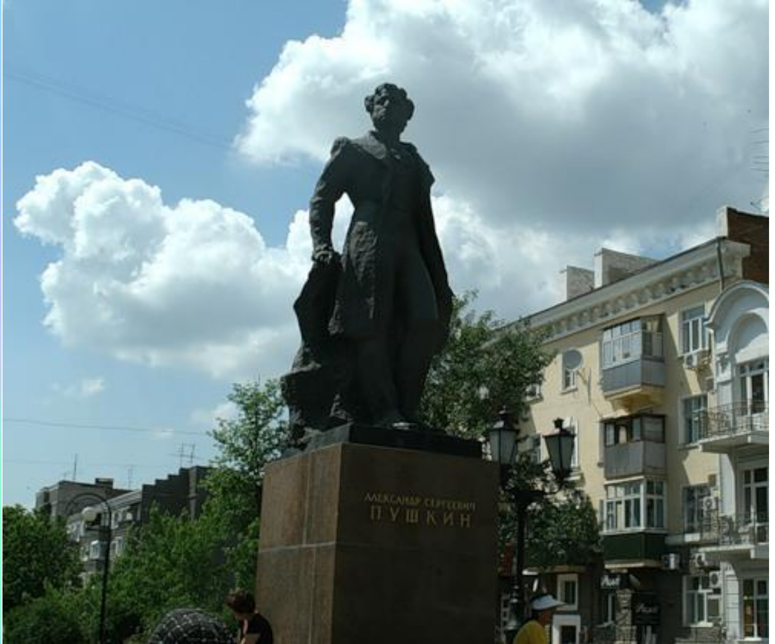
Великий русский поэт А.С. Пушкин