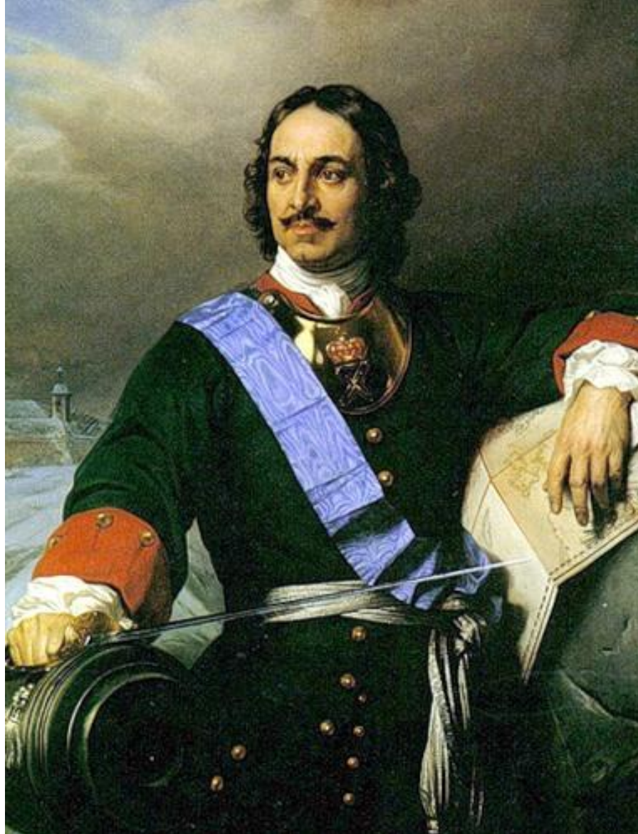
Портрет Петра I (1672-1725 г.)