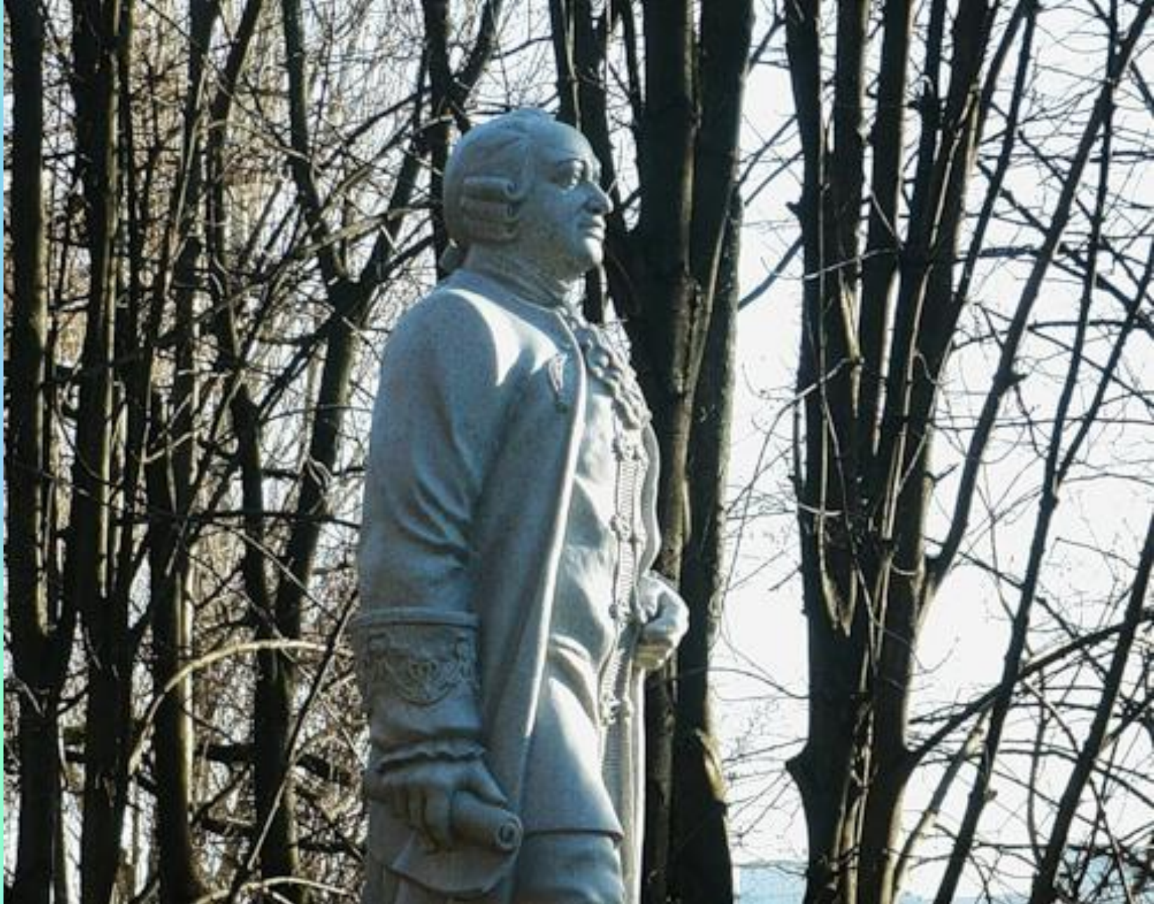
Великий русский ученый М.В. Ломоносов