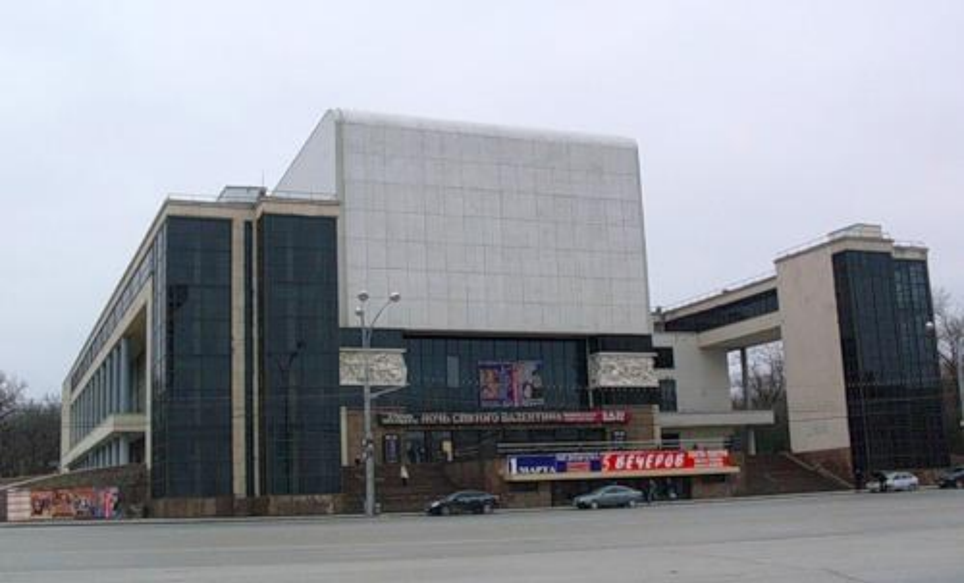
Драматический театр им.М. Горького