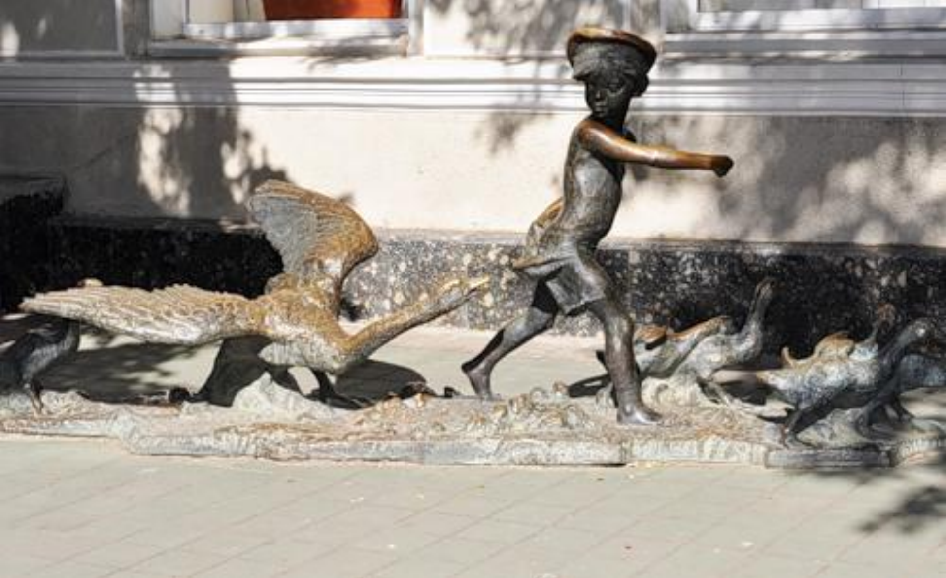
Нахаленок с гусями