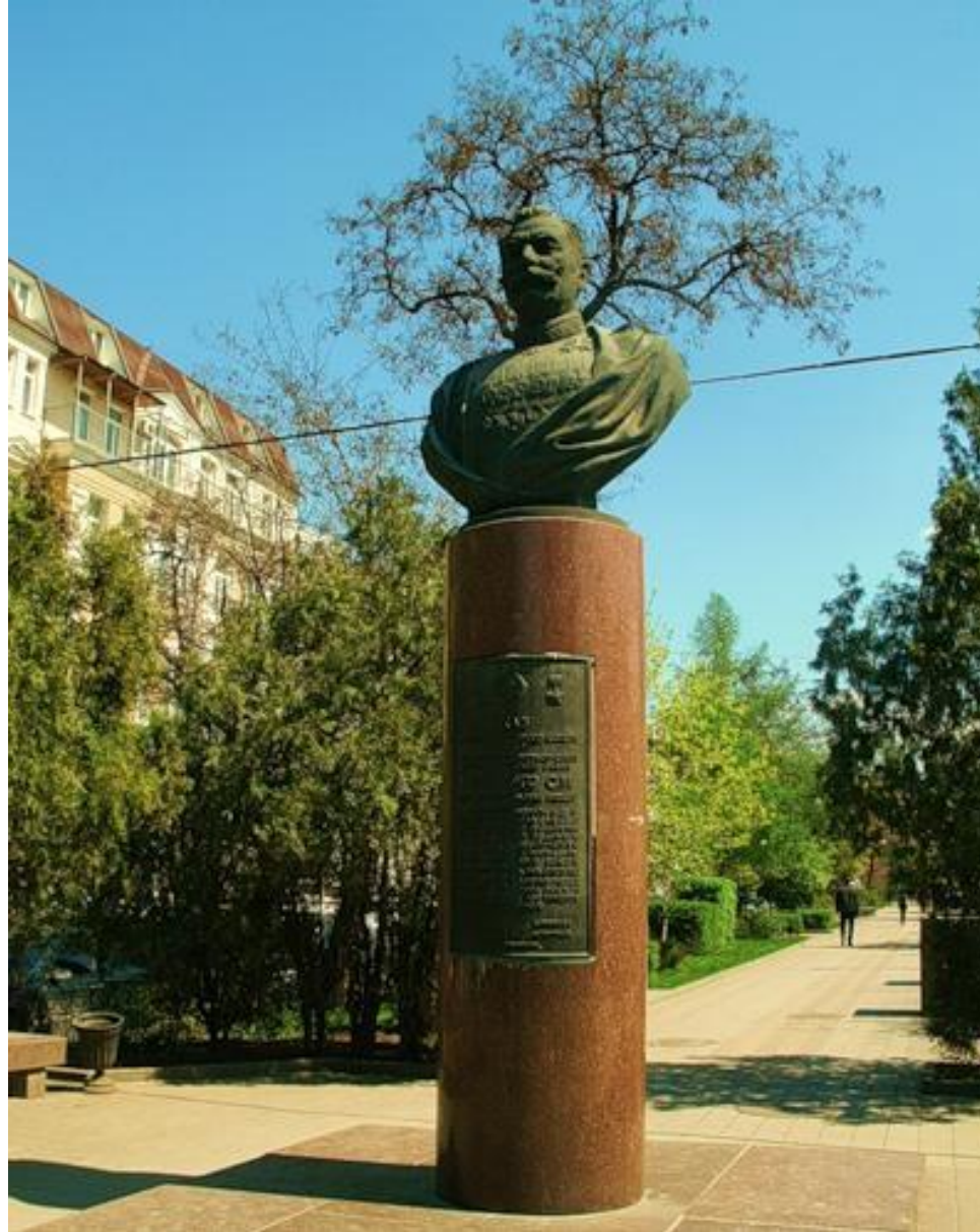
Памятник командарму С.М. Буденному