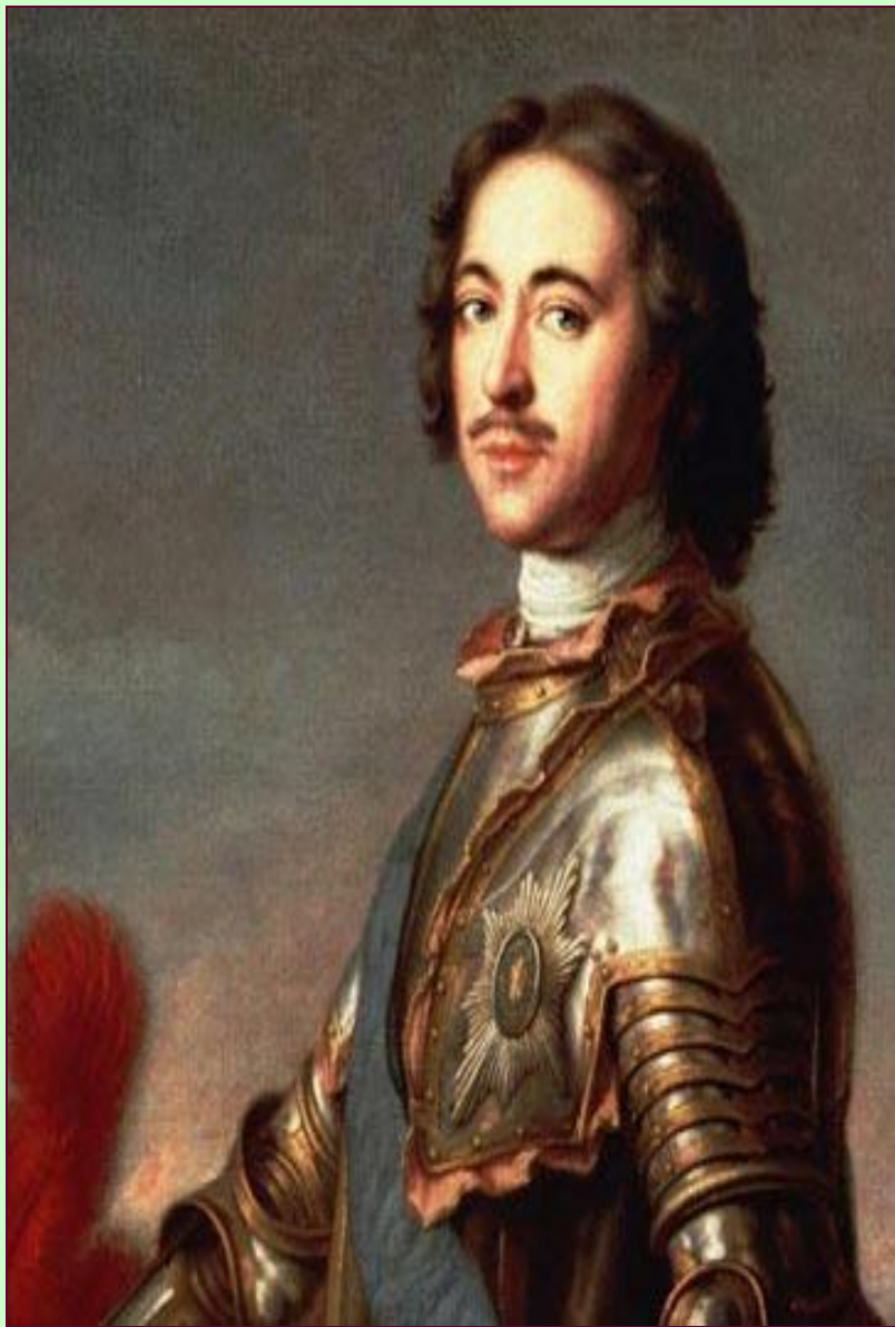
Император Пётр Великий