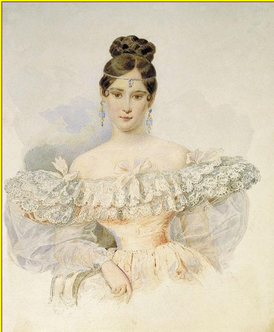
Наталья Николаевна Гончарова- супруга А.С. Пушкина