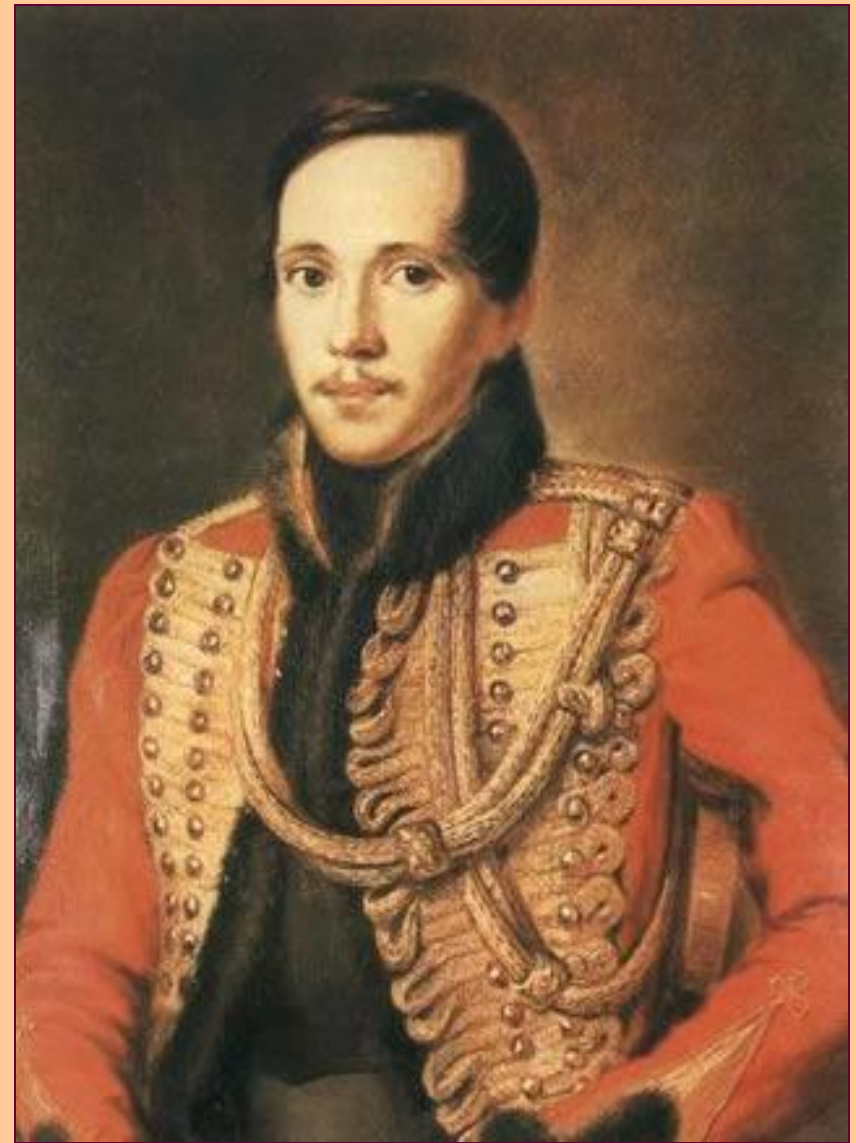
Михаил Юрьевич Лермонтов