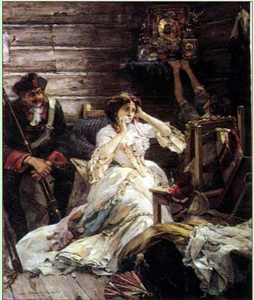
Мария Гамильтон - камер-фрейлина Екатерины I и фаворитка Петра I