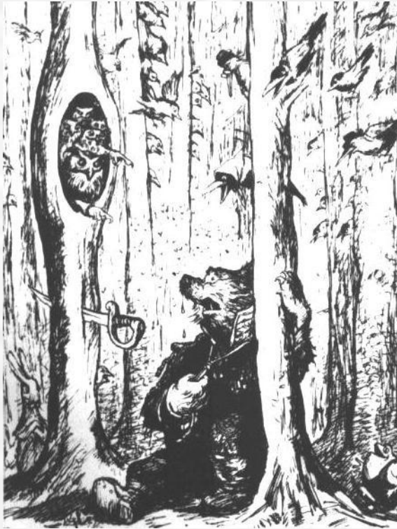
"Медведь на воєводстве"