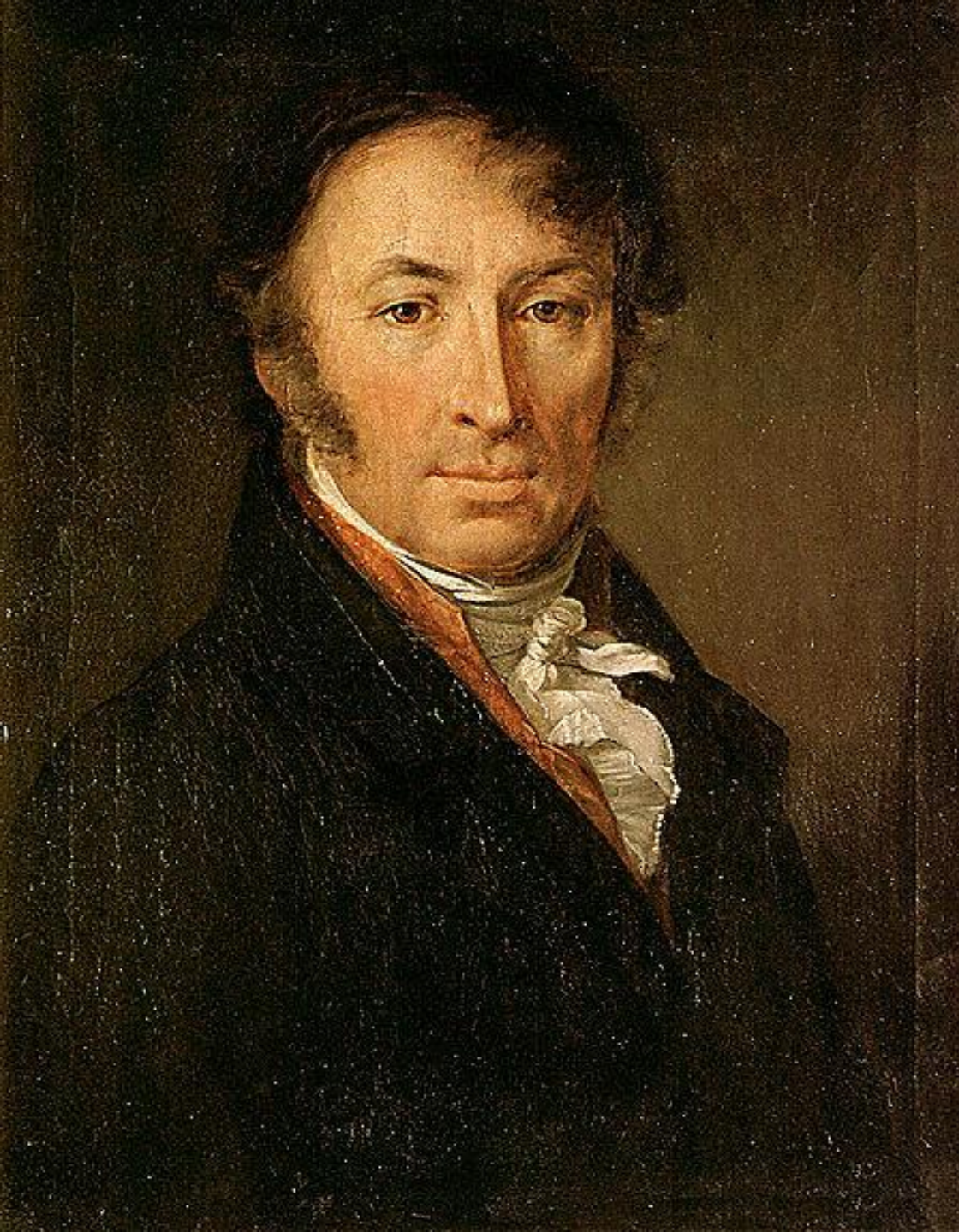
Николай Михайлович Карамзин (1766-1826). русский историк- историограф, писатель, поэт.