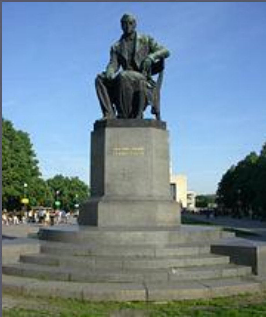
Памятник Грибоедову в Санкт-Петербурге (Пионерская площадь, возле ТЮЗа)