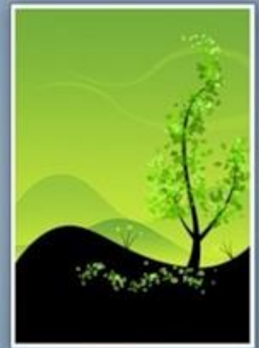
"Change Of Seasons" by Silveryn