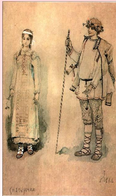
Снегурочка и Лель