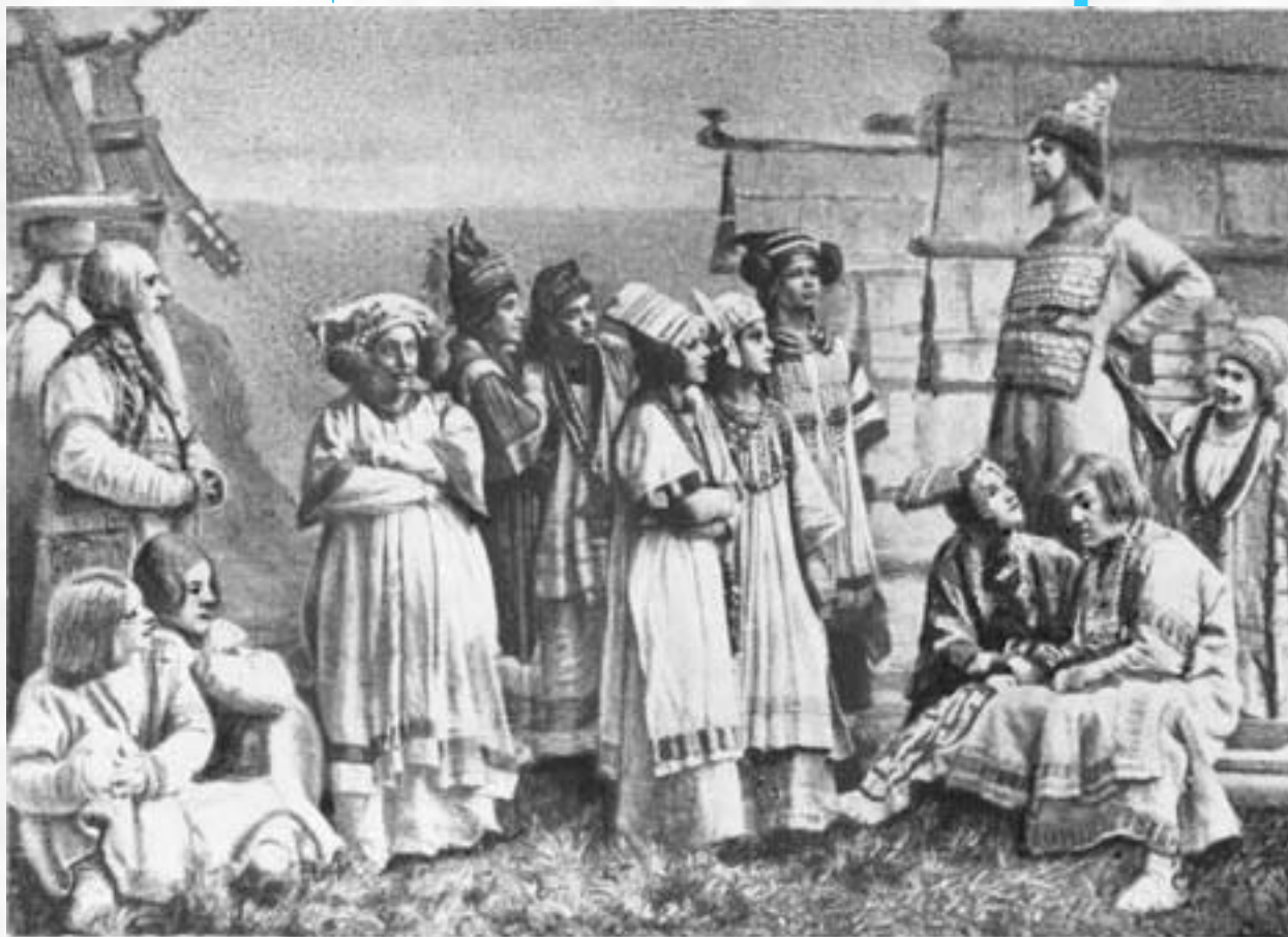
«Снегурочка». I-е действие