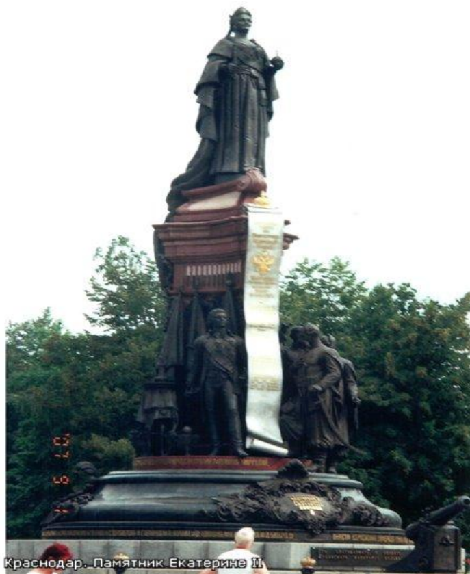
Краснодар. Памятник Екатерине II

Этот архитектор является автором проектов первого памятника Екатерине II в Санкт-Петербурге. О каком архитекторе идёт речь, и макет какого монумента был создан им для Екатеринодара?