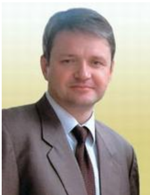
Александр Николаевич Ткачев

Какое славное имя нашему городу хочет вернуть губернатор?