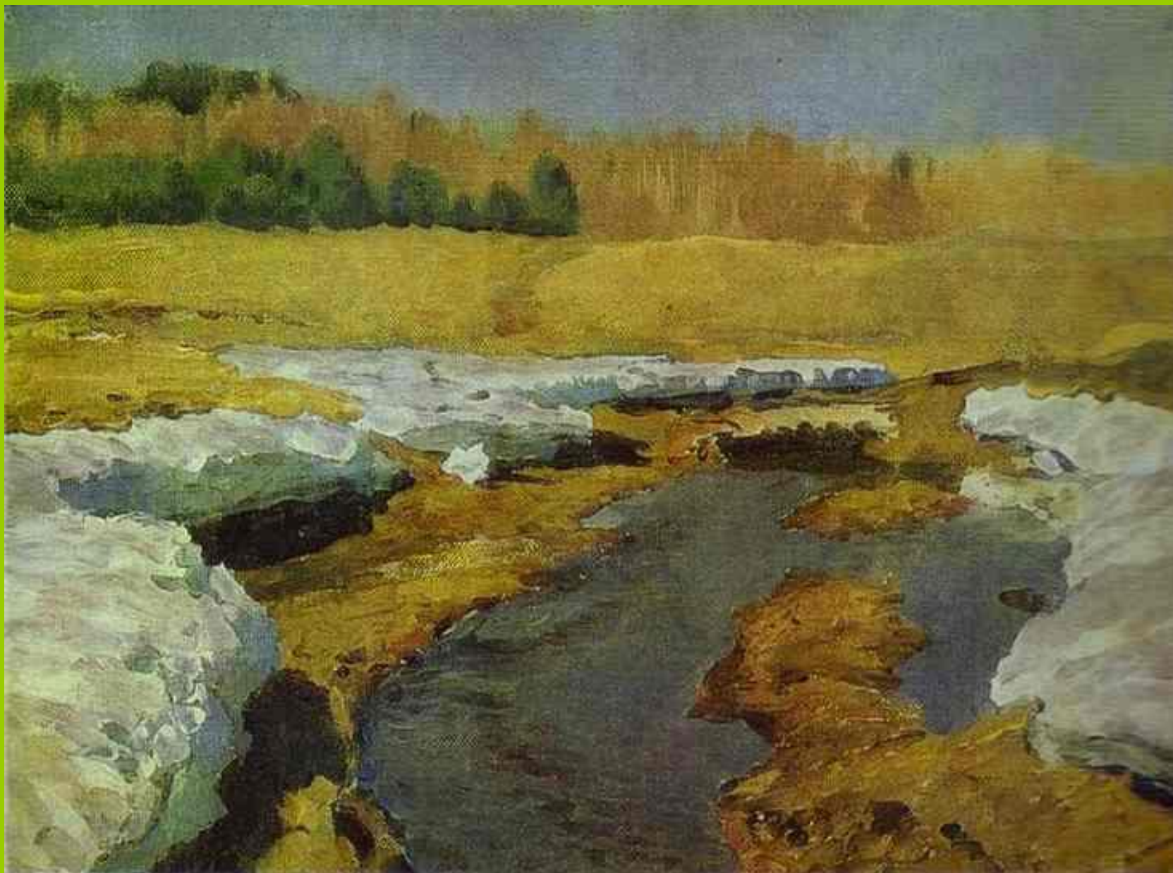
Весенняя пора. Последний снег. Левитан – П.И. Чайковский «Времена года. Апрель.»