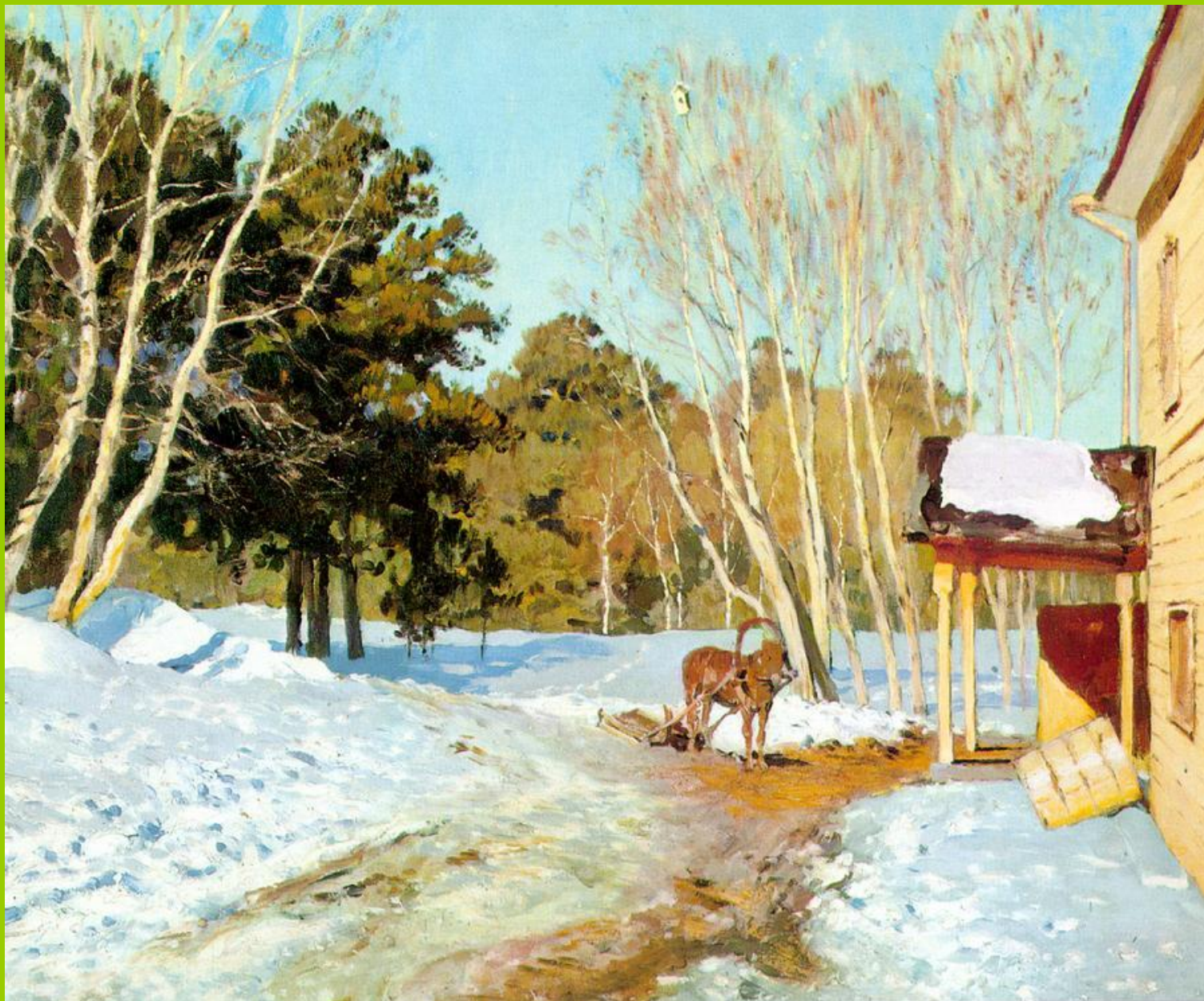
Март. Левитан – П.И. Чайковский «Времена года. Март.»