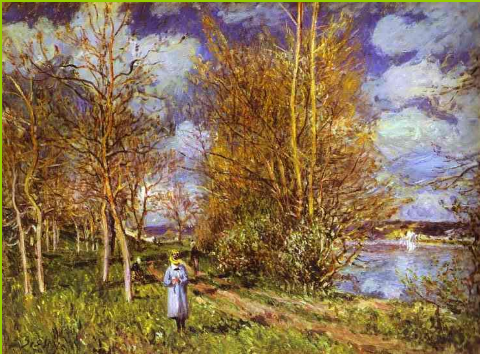
Весна. Альфред Сислей. Слушать – М. Глинка «Песня жаворонка».