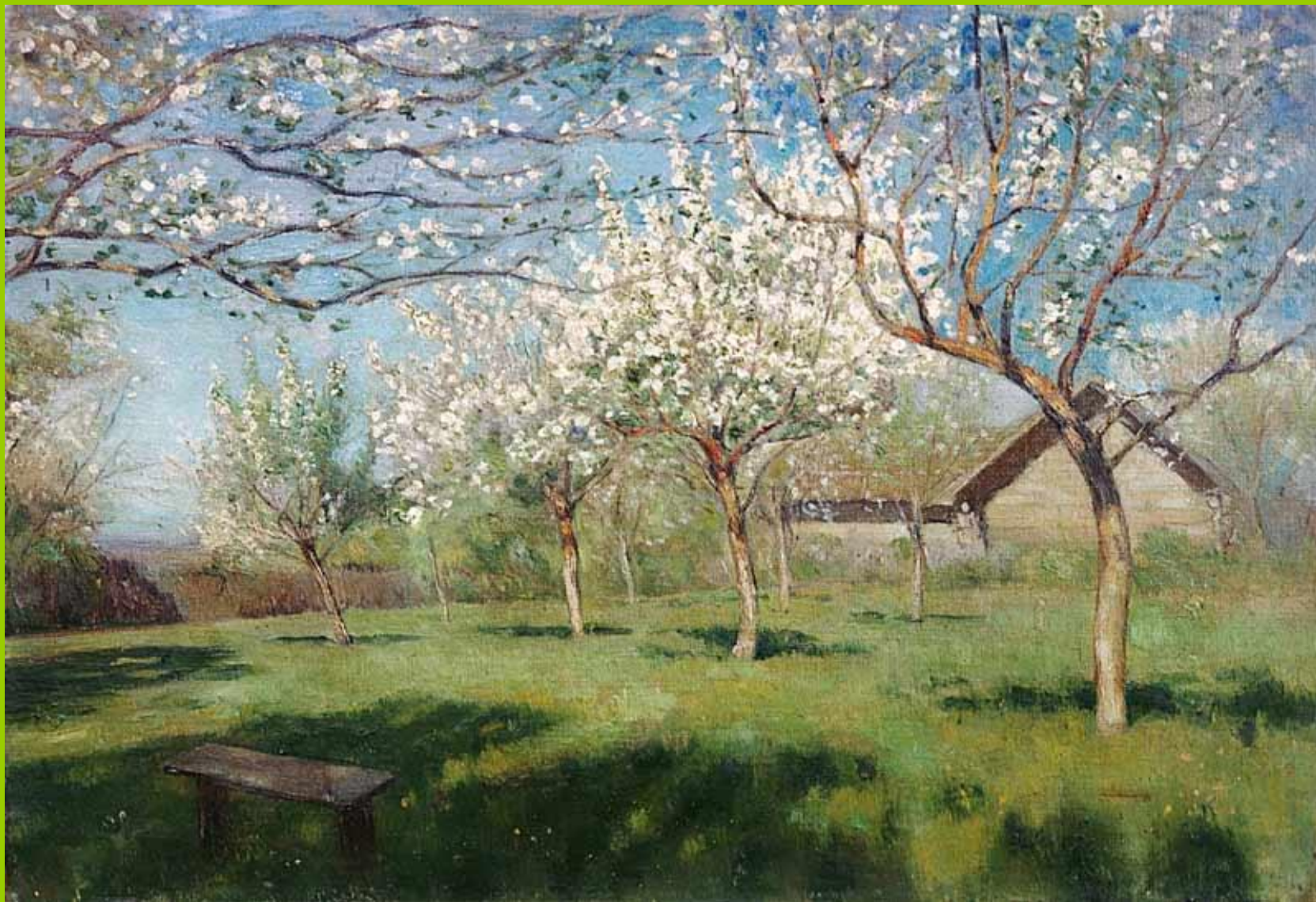
Цветущие яблони. Левитан – П.И. Чайковский «Времена года. Май.»