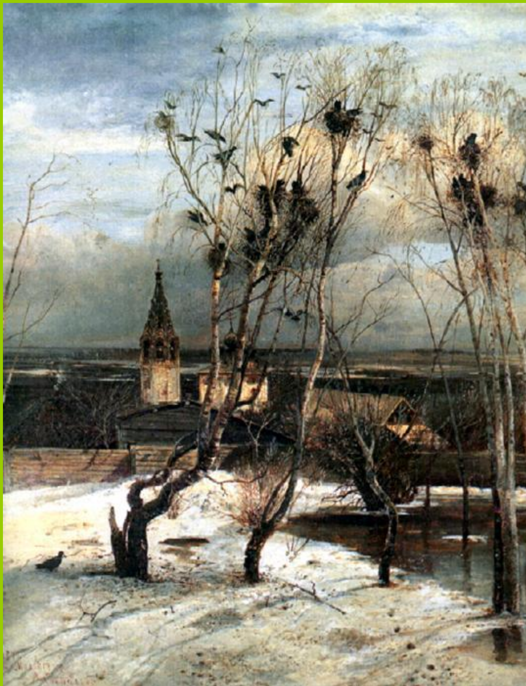
Грачи прилетели. А.К.Саврасов