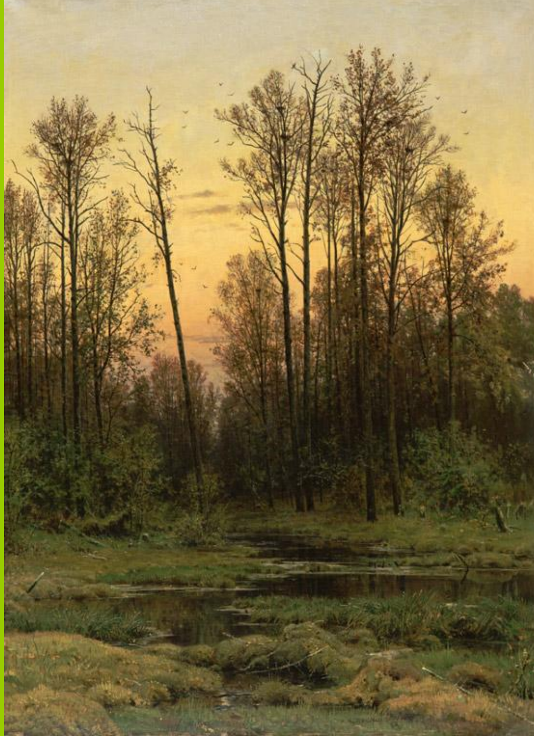
Лес весной. И.И.Шишкин