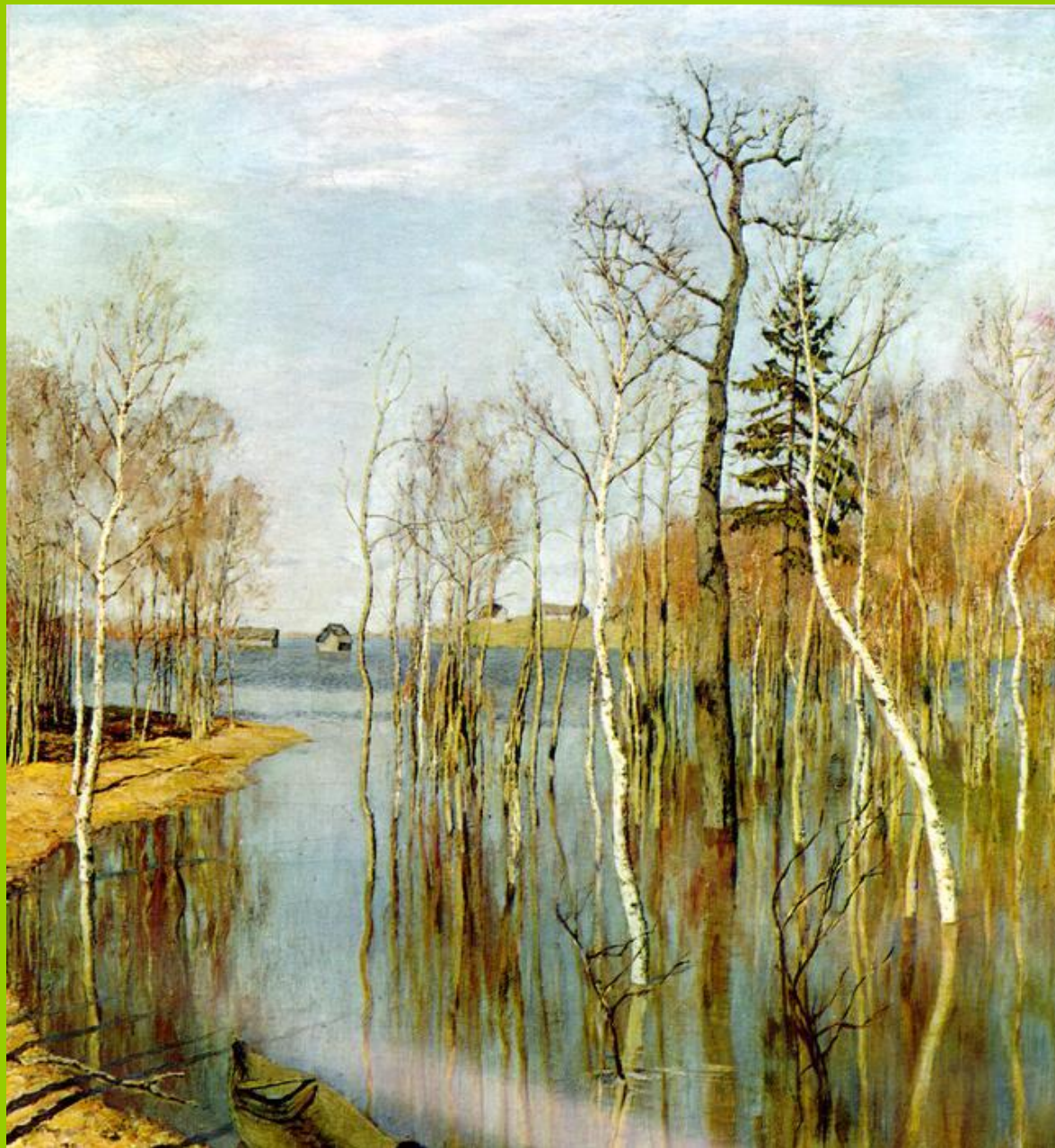
Весна. Большая вода. Левитан