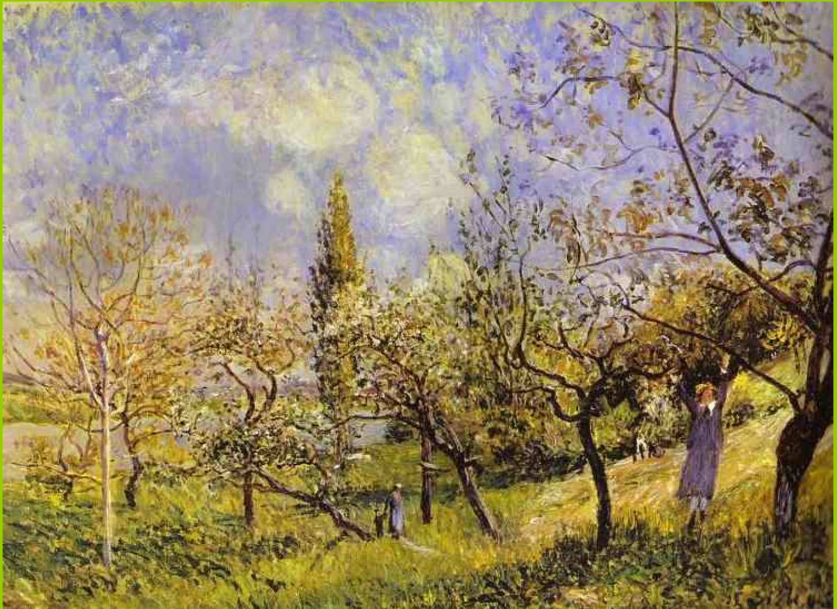
Фруктовый сад. Весна. Альфред Сислей – В. Моцарт «Времена года. Май.»