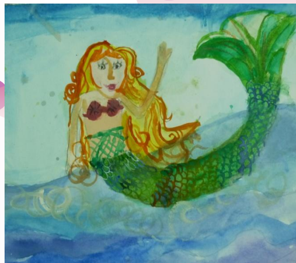
Полина, 7 лет