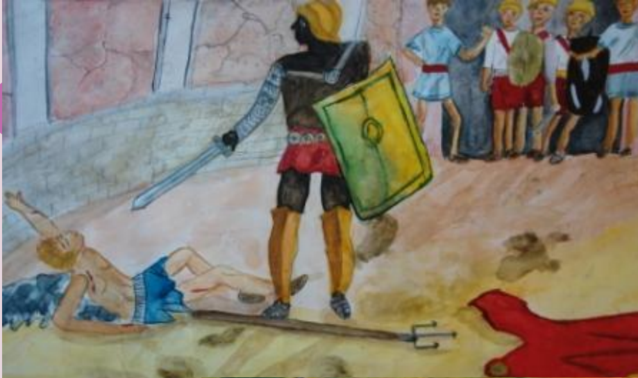
На конкурс, 2007 г.