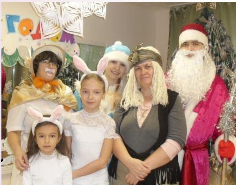
Новогодний утренник, СП «Мечтатель», 2010 г.