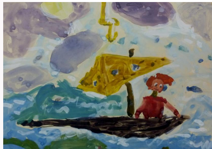
Сереза, 6 лет