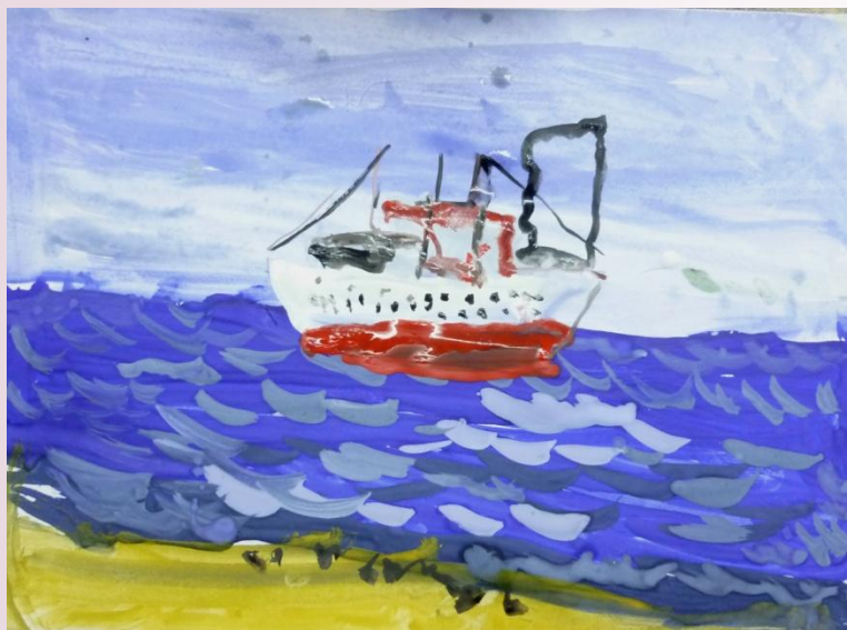
Марк, 5 лет