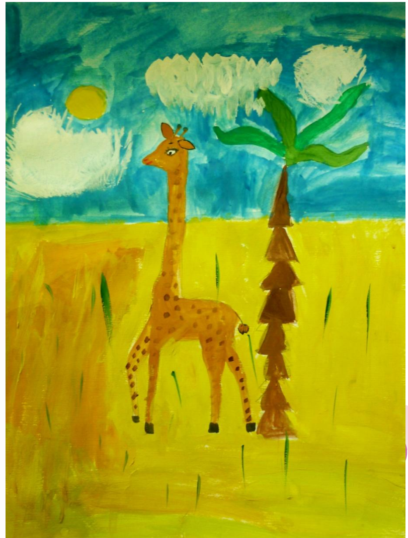
«Жираф» Катя, 6 лет