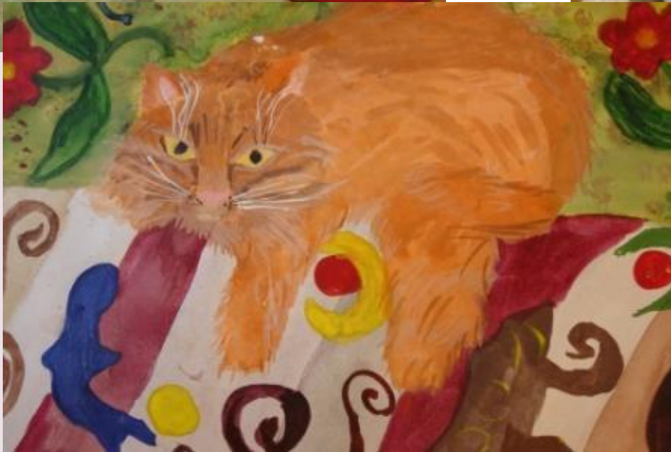
На конкурс, 2006 г.