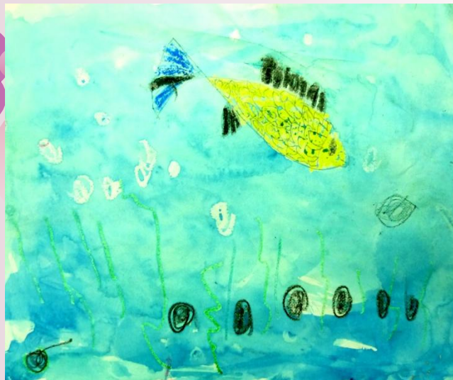
Кирилл, 5 лет