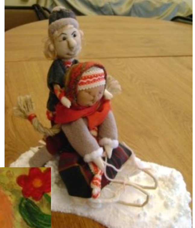
Конкурс «Малахитовая шкатулка», 2009 г.