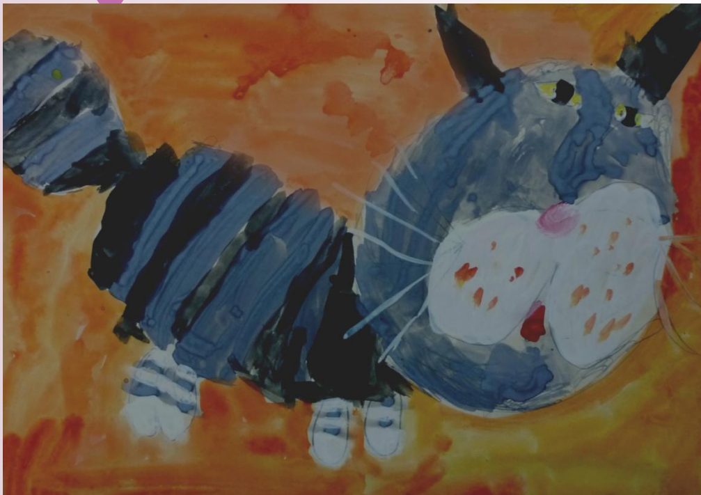
«Мой котенок», Коля, 5 лет