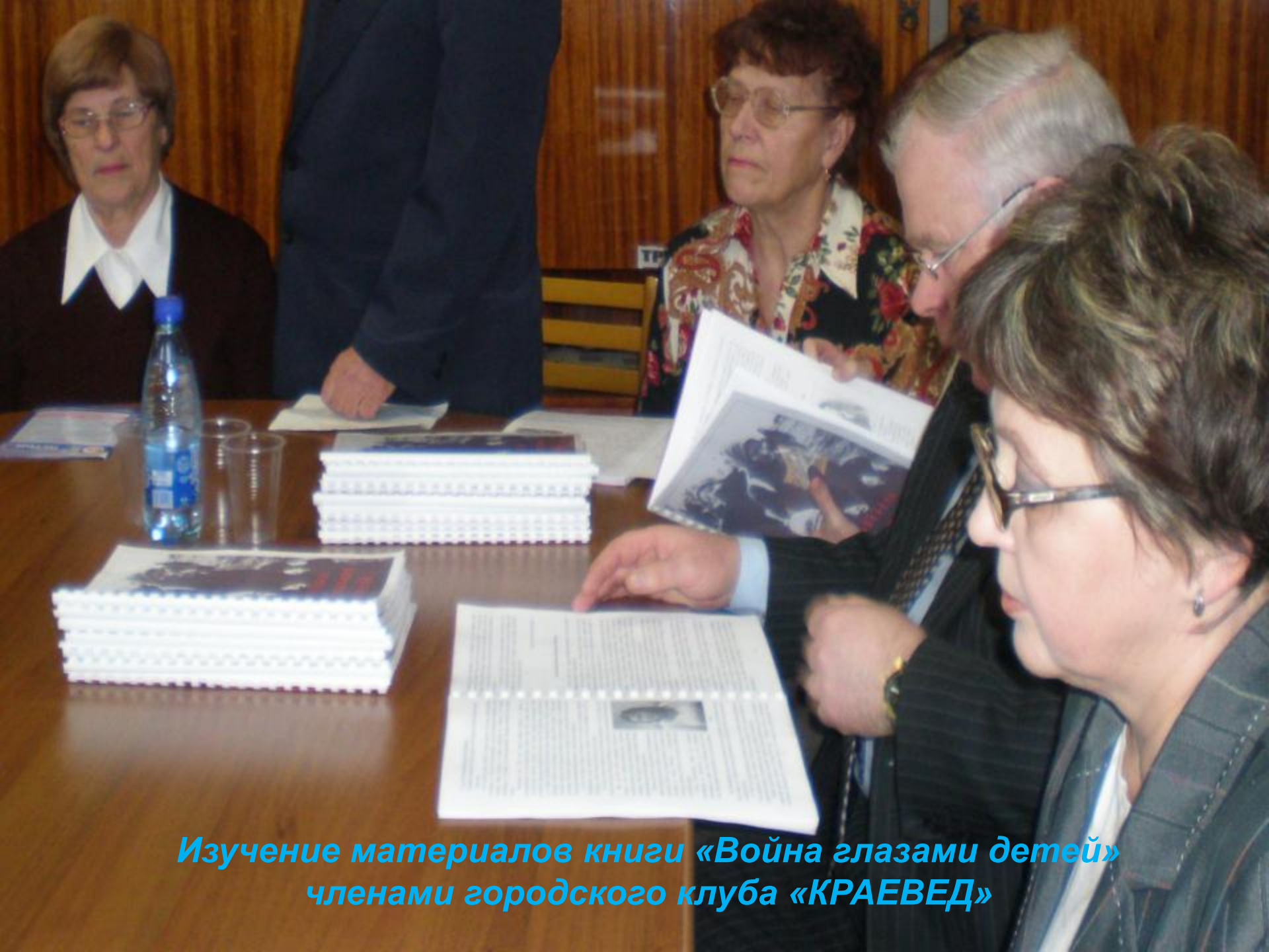
Изучение материалов книги «Война глазами детей» членами городского клуба «КРАЕВЕД»