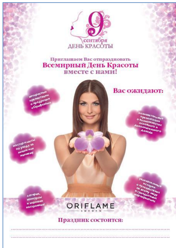
Плакат-анонс мероприятия А4