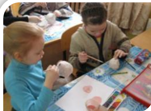
На уроке ИЗО раскрасили её.