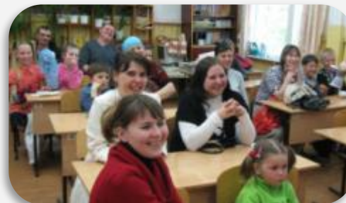
Итогом данного проекта явилось выступление перед родителями на родительском собрании.