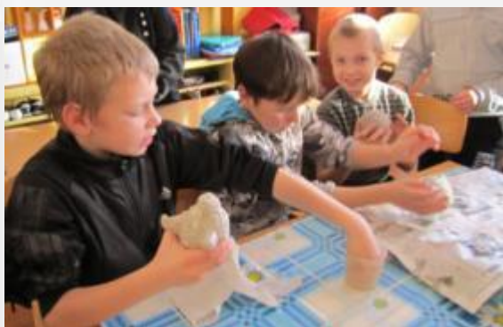
На уроке технологии изготовили голову куклы в технике «папье- маше».