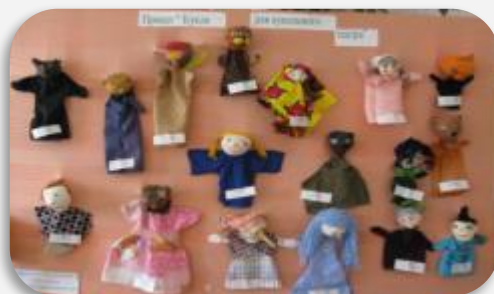
Дома вместе с мамами сшили одежду для своей куклы