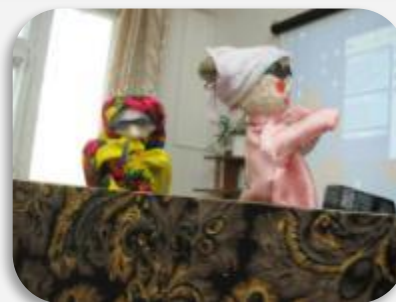
По семейкам придумали сказку.