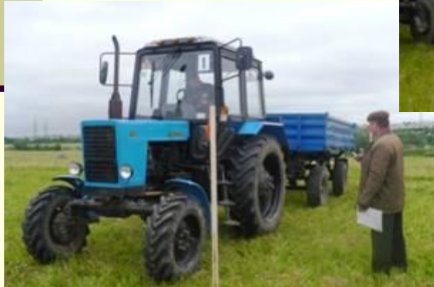
Практический тур олимпиады