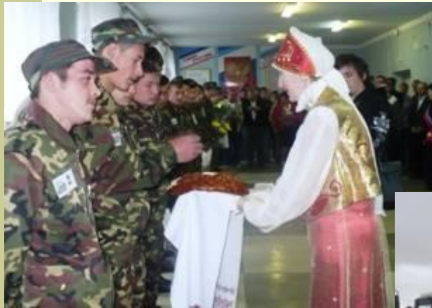
«Хлеб-соль» на открытии олимпиады

Участниками стали 14 обучающихся учреждений начального, среднего и высшего профессионального образования