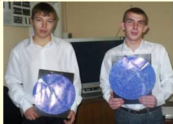
4 тематических сайта, посвящённые 50-летию полёта Ю. Гагарина в космос направлены на всероссийский конкурс медиатворчества