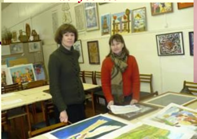
Жюри за работой

Выставка проектов направления «Изобразительное искусство»