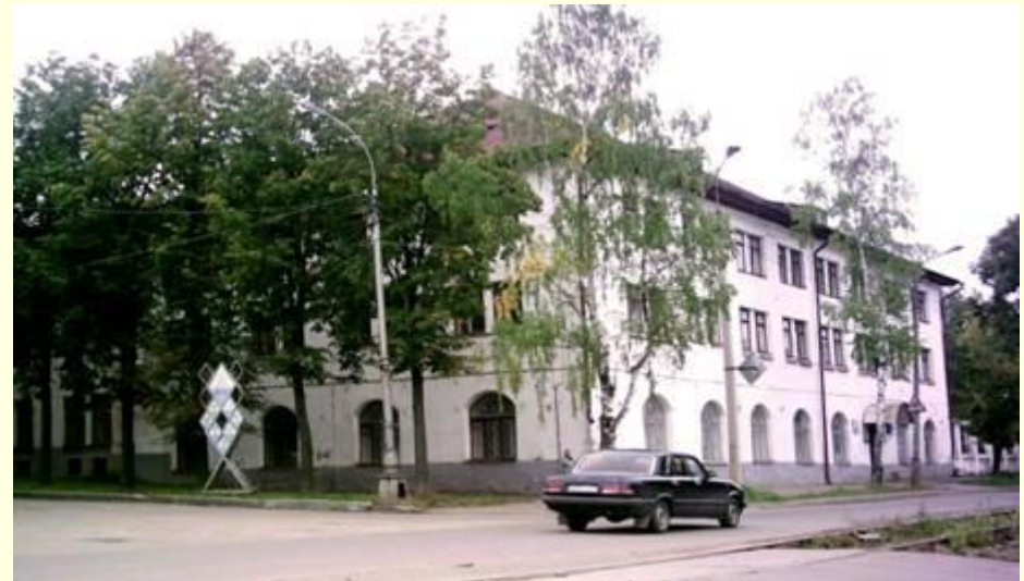
ОГБОУ ДОД «Костромской областной центр научно-технического творчества «Истоки»

Олимпиада технического творчества «Радуга талантов» вошла в число региональных программ по выдвижению кандидатов на соискание премии Президента Российской Федерации приоритетного национального проекта «Образование» в части государственной поддержки талантливой молодежи