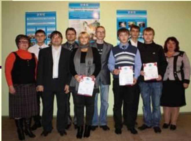
Члены жюри с призёрами и участниками олимпиады