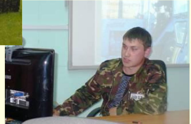
Олимпиада технического творчества