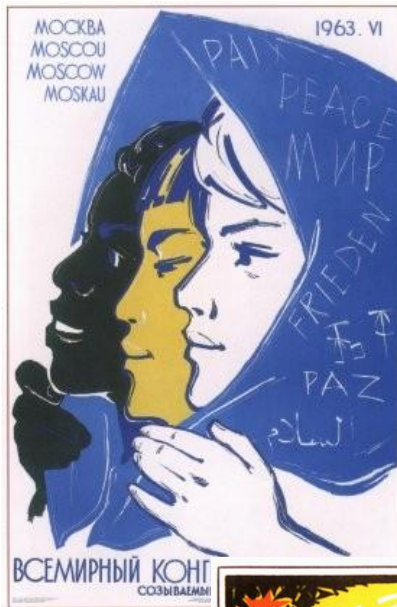
150. Сурияинов Р. Всемирный конгресс женщин, со-