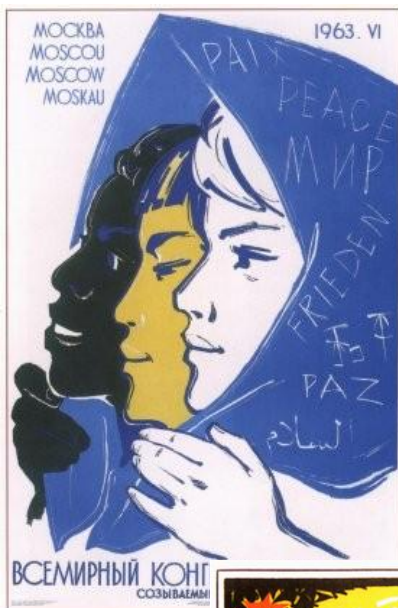
150. Сурияинов Р. Всемирный конгресс женщин, со-