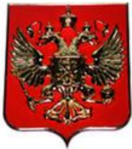
Рисунок орла на гербе исходит из эпохи правления Петра I. Это один из древних символов борьбы добра над злом, света с тьмой, защиты Отечества.