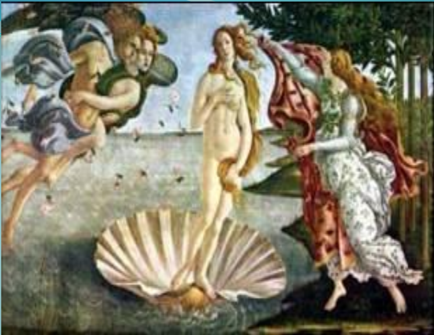
Сандро Боттичелли «Рождение Венеры»