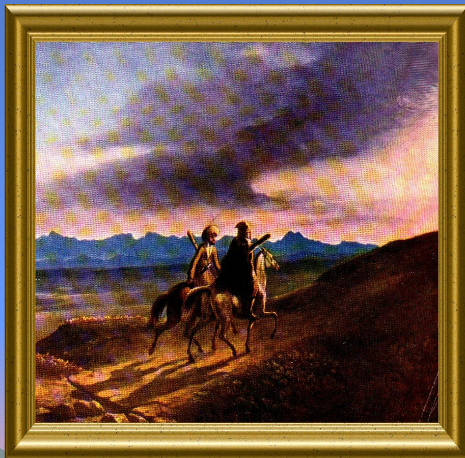
Воспоминание о Кавказе 1838 г.