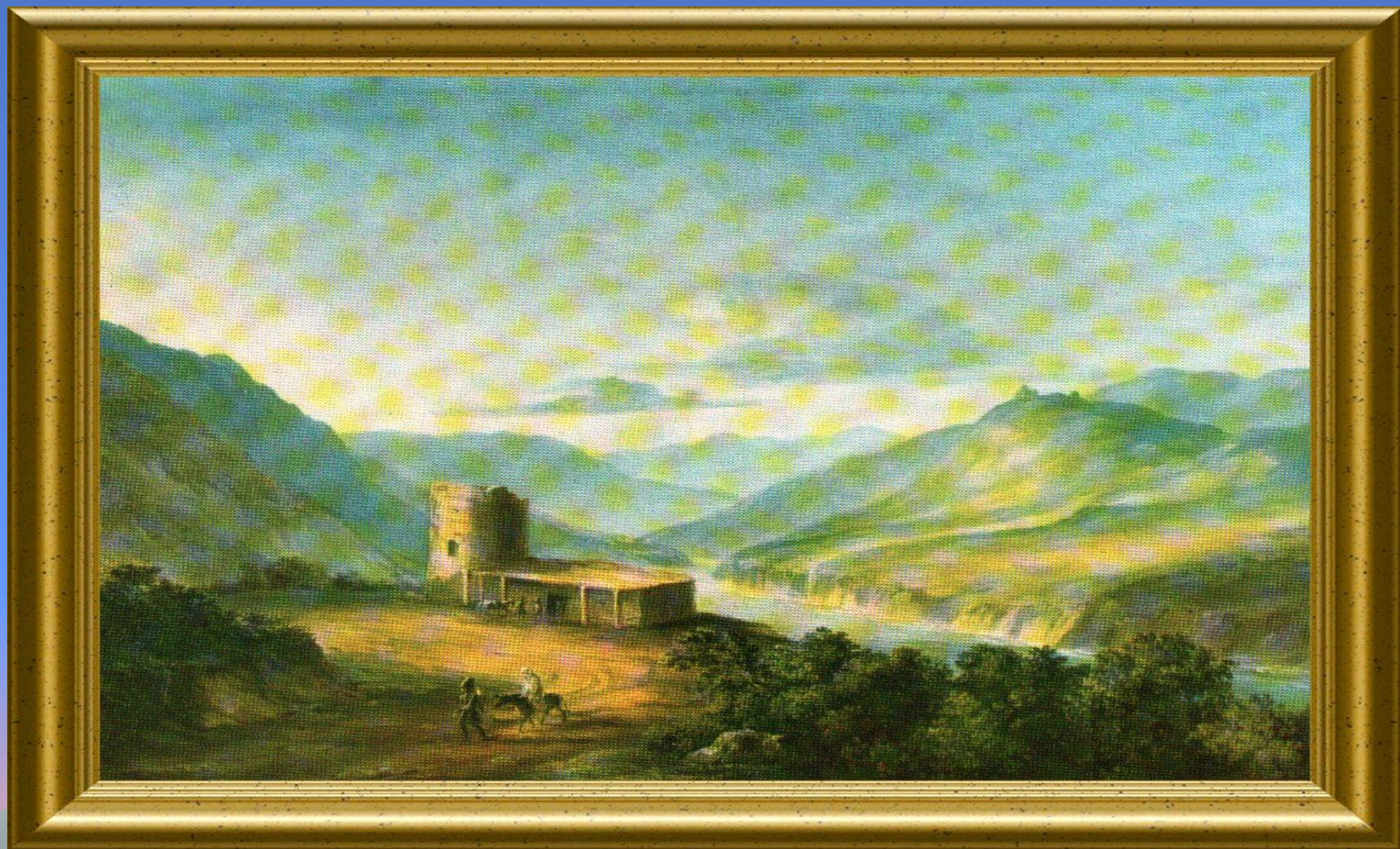
М.Ю. Лермонтов 1837 г.