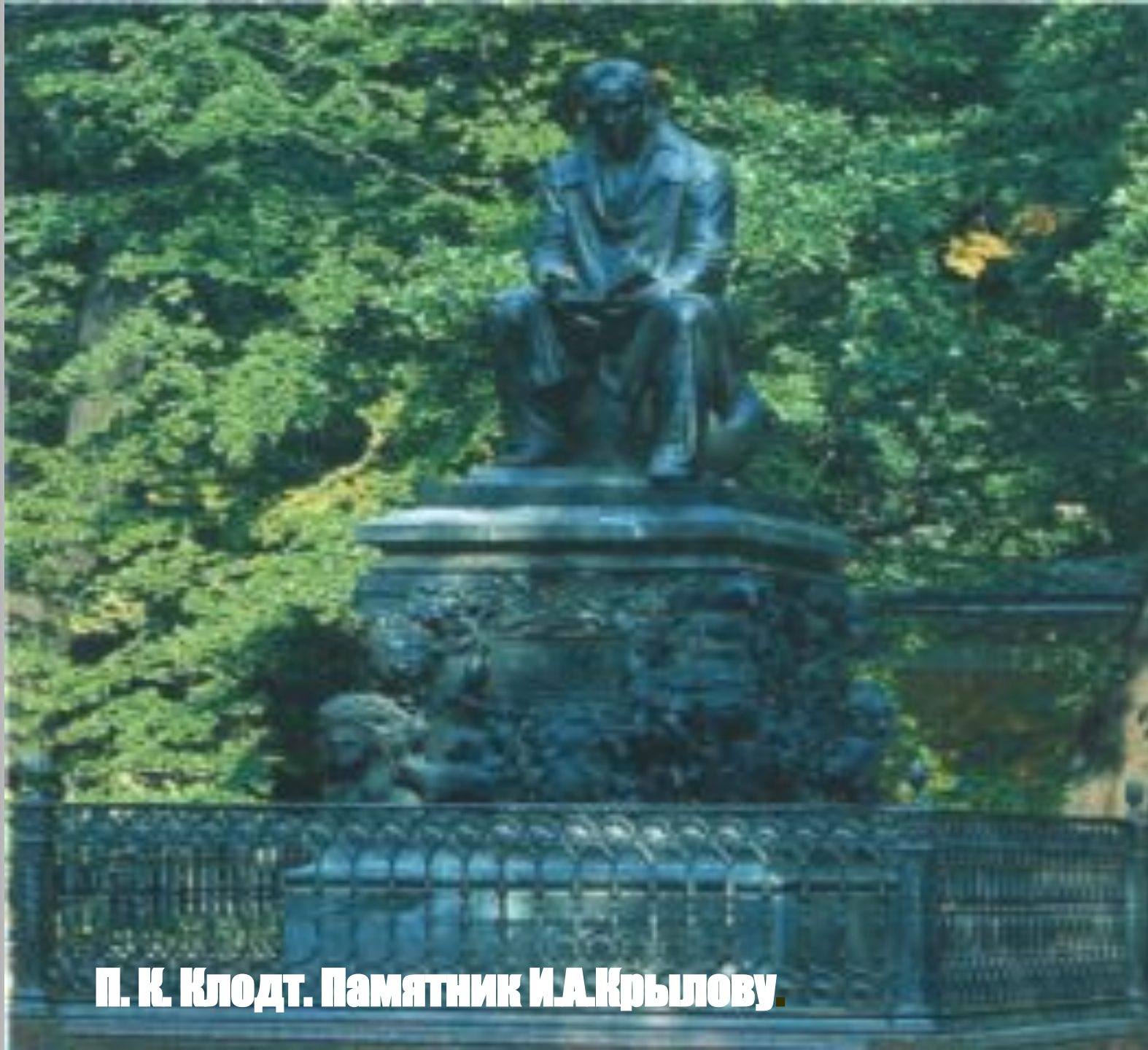
П. К. Клодт. Памятник И.А.Крылову.