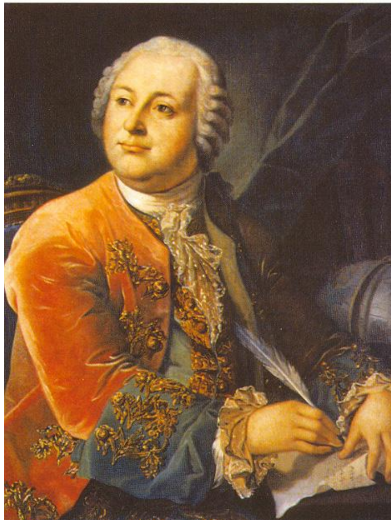
Ломоносов Михаил Васильевич