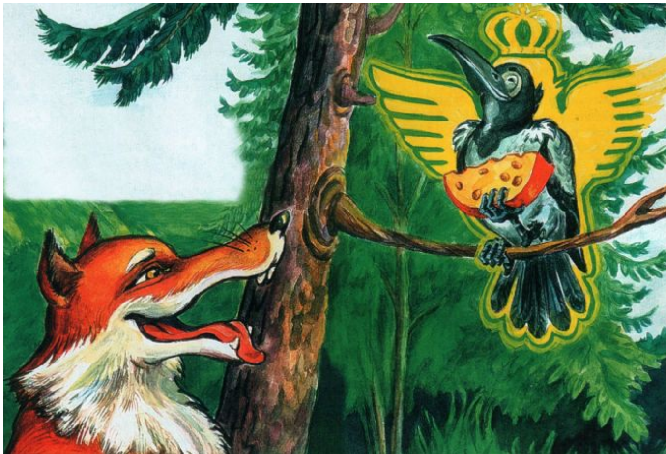
Иллюстрация к басне «Ворона и Лисица». Художник А. Чубукова.