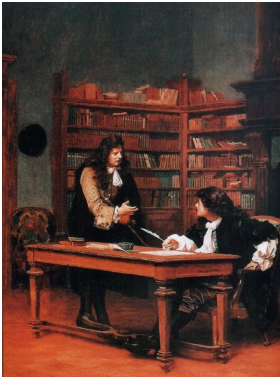
Жан-Леон Жером. Лафонтен и Мольер. 1890