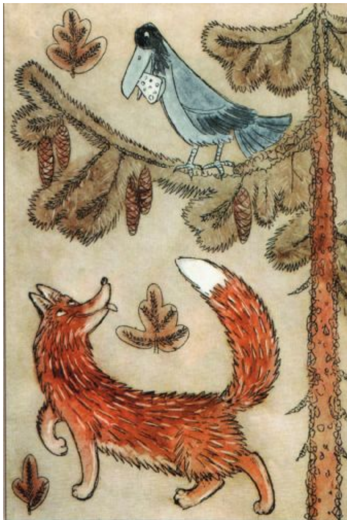
Н.Строганова, М. Алексеев. Ворона и лисица