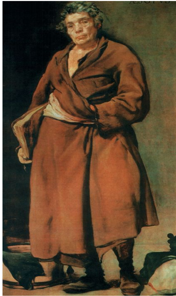
Диего Веласкес. Эзоп. 1639-1640