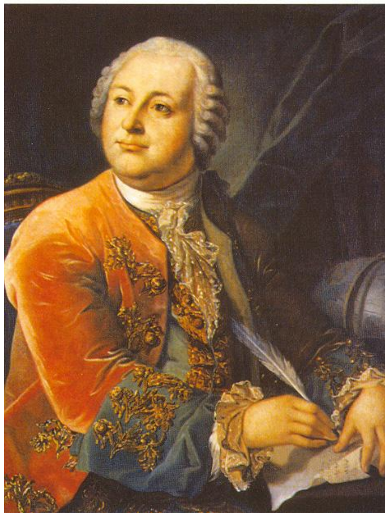
Ломоносов Михаил Васильевич