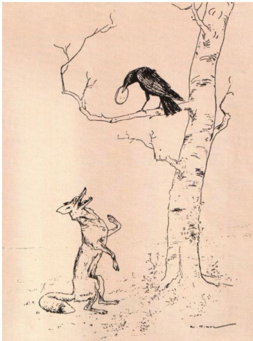
Иллюстрация к басне Эзопа и Лафонтена «Ворона и Лисица». Художник Вимар. Париж. 1898