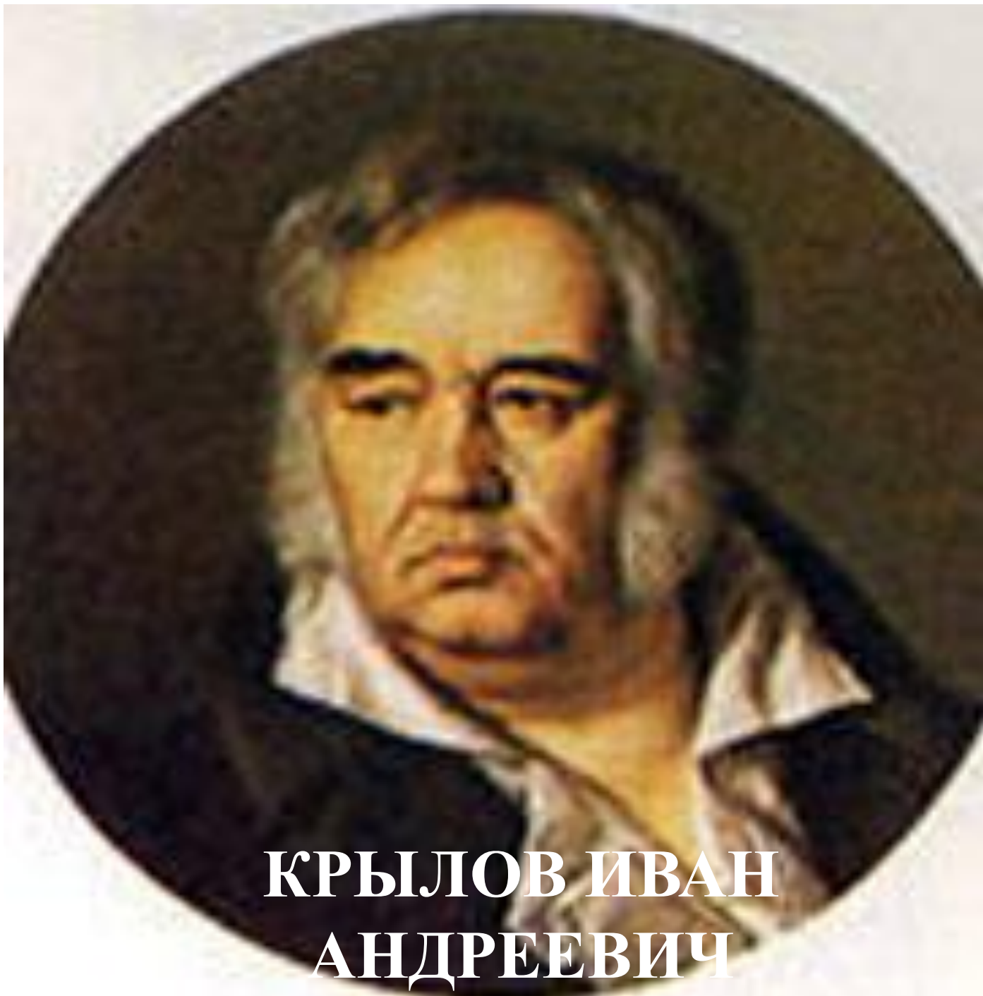
КРЫЛОВ ИВАН АНДРЕЕВИЧ