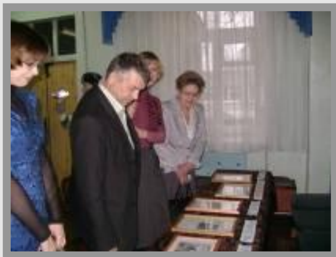
Дети поэта на презентации переизданной книги