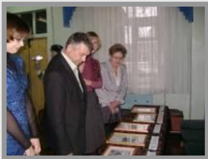
Дети поэта на презентации переизданной книги