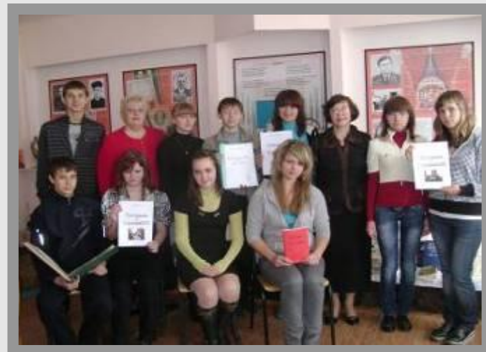
Творческая группа «Истоки»