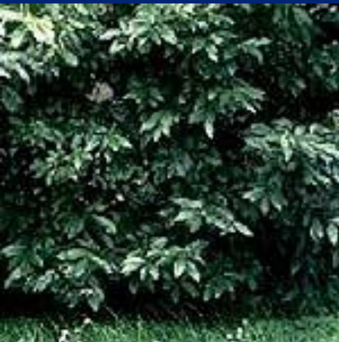
Лавр благородный (Laurus Nobilis) Местное название-Алей Дафна