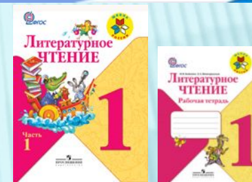
Литературное чтение: Учебник: 1 класс: В 2 ч., рабочая тетрадь Климанова, Горецкий, Голованова