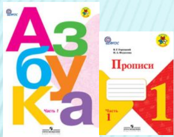
Горецкий В.Г., Азбука Федосова Н.А, Прописи