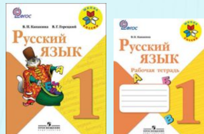
Канакина В.П., Горецкий В.Г. Русский язык: Учебник: 1 класс, рабочая тетрадь