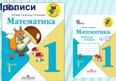
М.И. Моро «Математика»