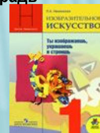
Неменская Л.А. Изобразительное искусство. Ты изображаешь, украшаешь и строишь