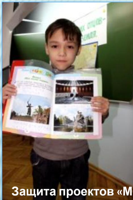
Защита проектов «Моя малая Родина»