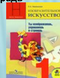
Неменская Л.А. Изобразительное искусство. Ты изображаешь, украшаешь и строишь