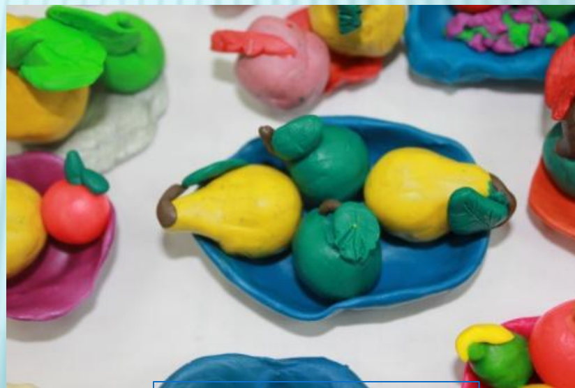
Творческий конкурс «Мы лепили апельсин»