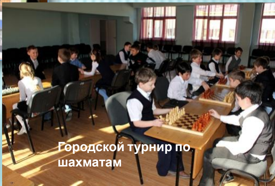
Городской турнир по шахматам