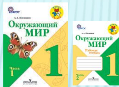
А.А.Плешаков «Окружающий мир»