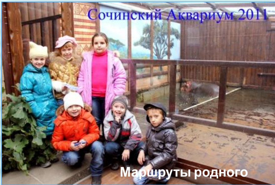
Маршруты родного города