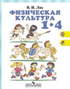
В.И.Лях Физическая культура