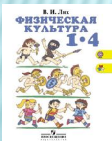
В.И.Лях Физическая культура