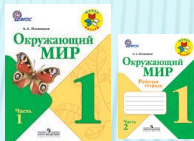
А.А.Плешаков «Окружающий мир»