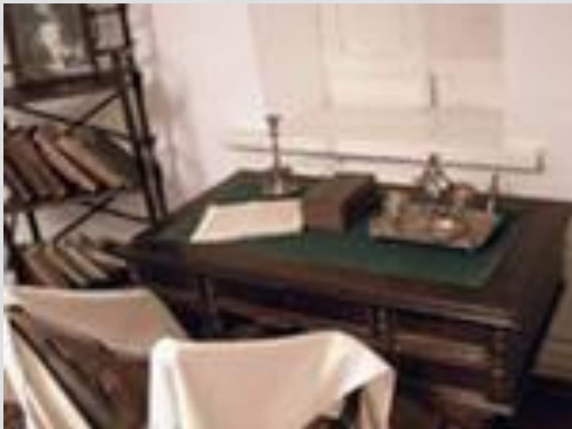
Кабинет Коста Хетагурова