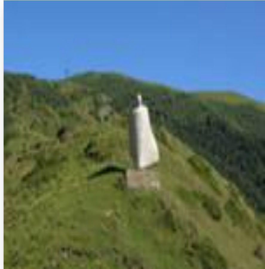
Памятник Коста Хетагурову в селении Нар(зима-лето)