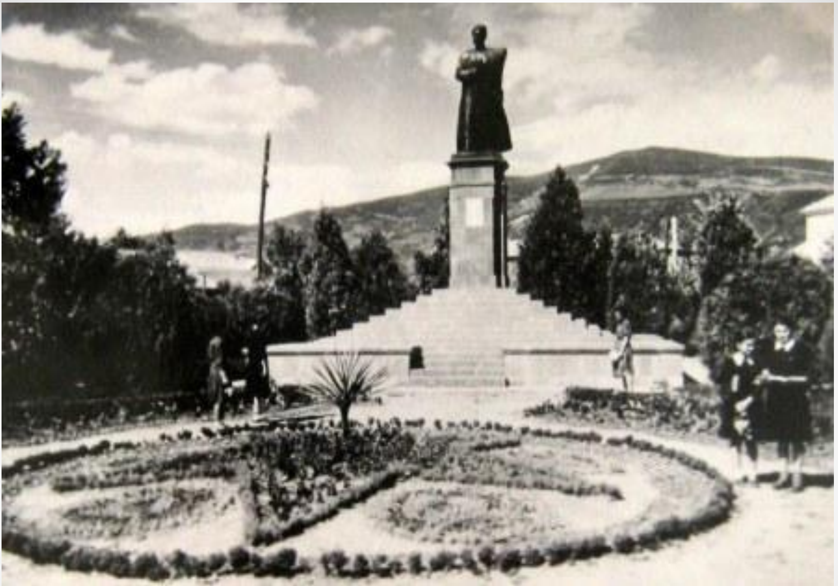
Памятник Коста Хетагурову в Ставрополе