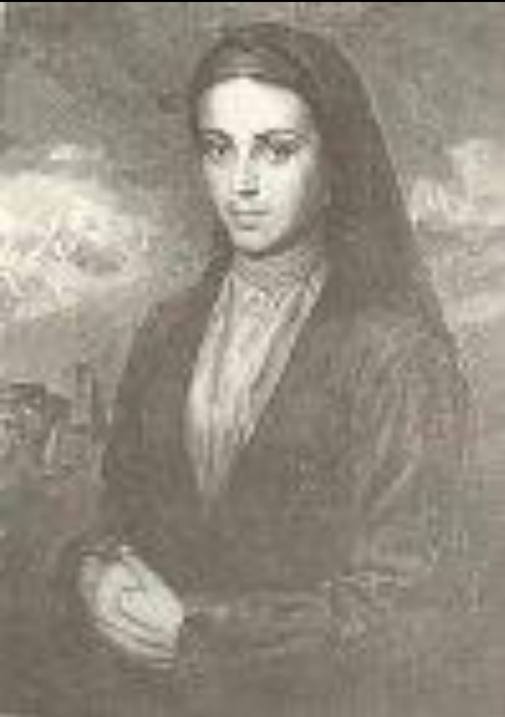
Мать Коста Хетагурова