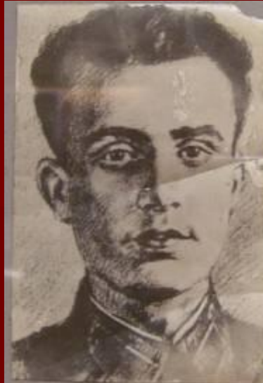
ПАПЕРНИК ЛАЗАРЬ ХАЙМОВИЧ ГЕРОЙ СОВЕТСКОГО СОЮЗА ПОЛИТРУК ОТРЯДА