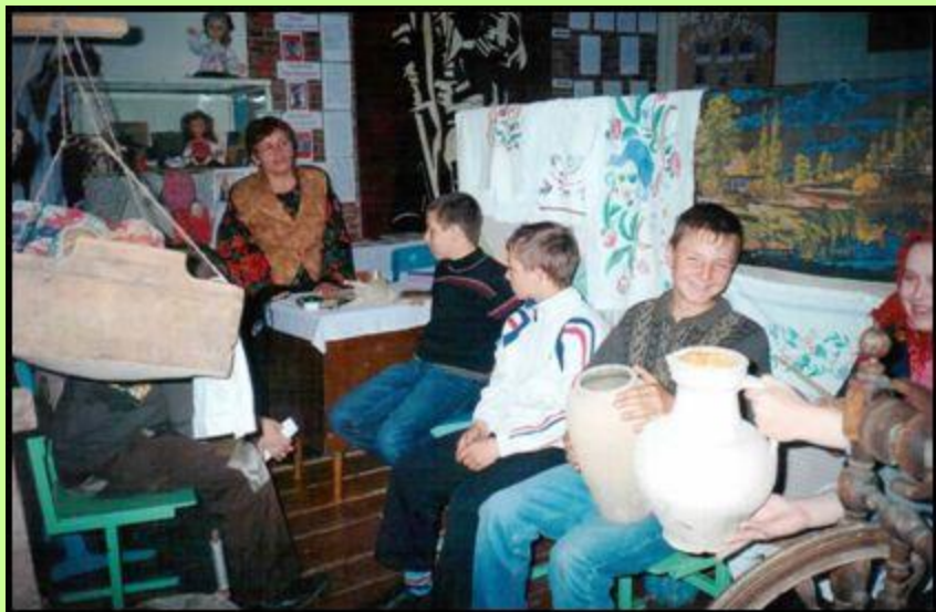
Внеклассное занятие «Родная старина»