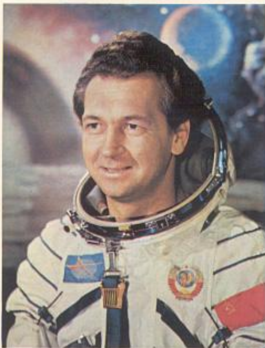
Дважды Герой Советского Союза, летчик-космонавт СССР Виталий Иванович СЕВАСТЬЯНОВ