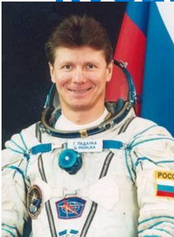
Геннадий Иванович Падалка