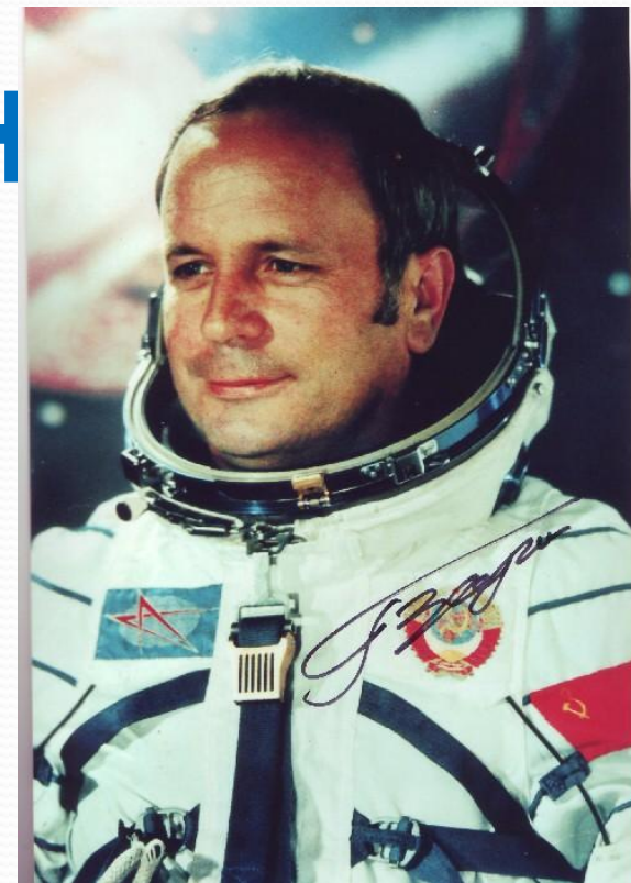
Горбатко Виктор Васильевич