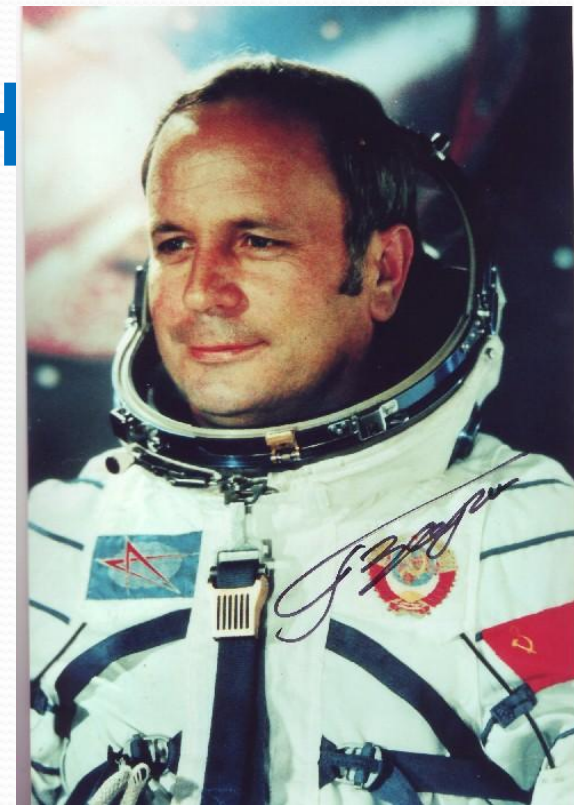
Горбатко Виктор Васильевич