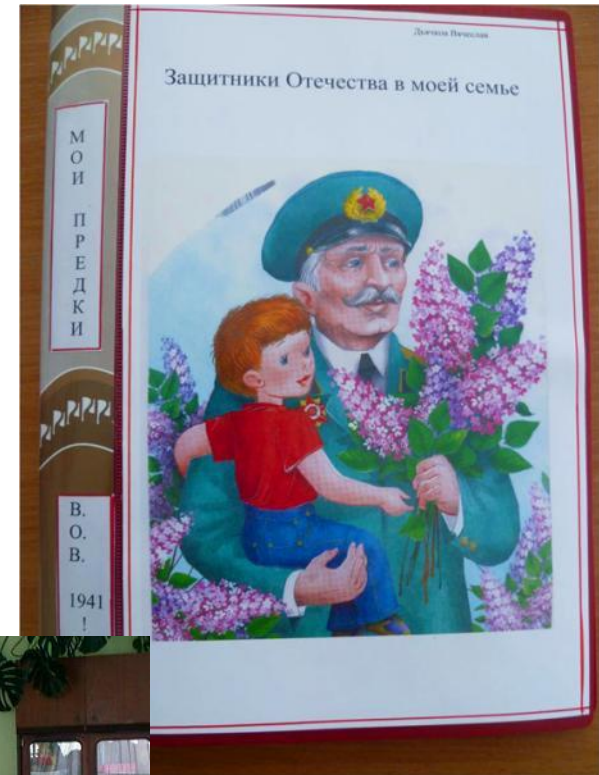
Альбом «Защитники Отечества в моей семье»