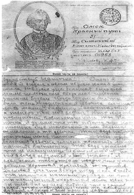
Последнее письмо с фронта