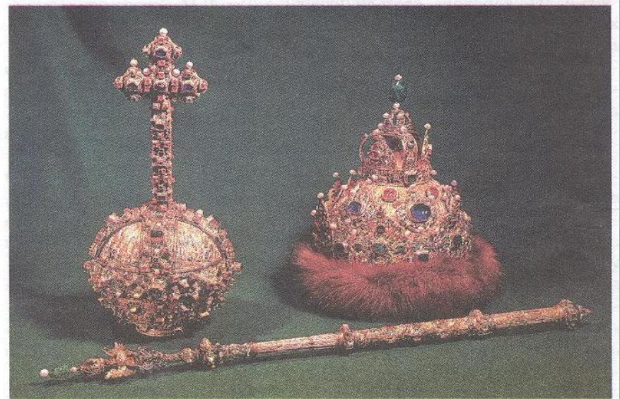
Знаки царской власти Михаила Романова: держава, венец (корона), скипетр.