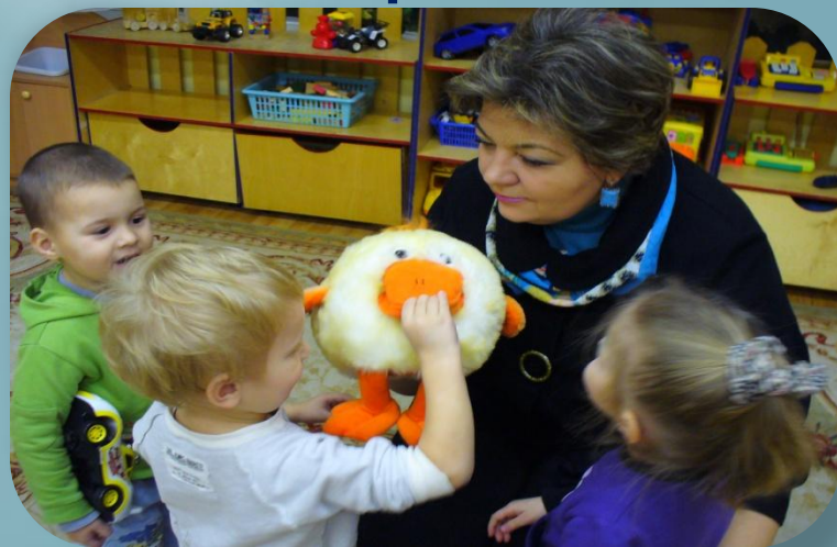
рисунок или лепку, что в данный период жизни является для малыша дополнительным речевым органом, т.к. двигательная активность и