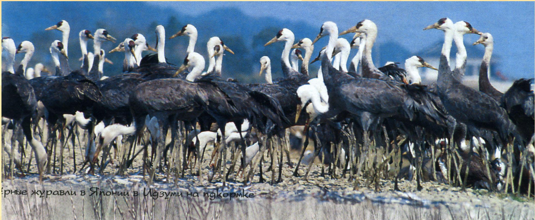
Черные журавли в Японии в Иззуми на подкормке

В сентябре семьи покидают родные болота, улетая на зимовку в Японию. Летят они ночью, поэтому их трудно увидеть даже специалистам.