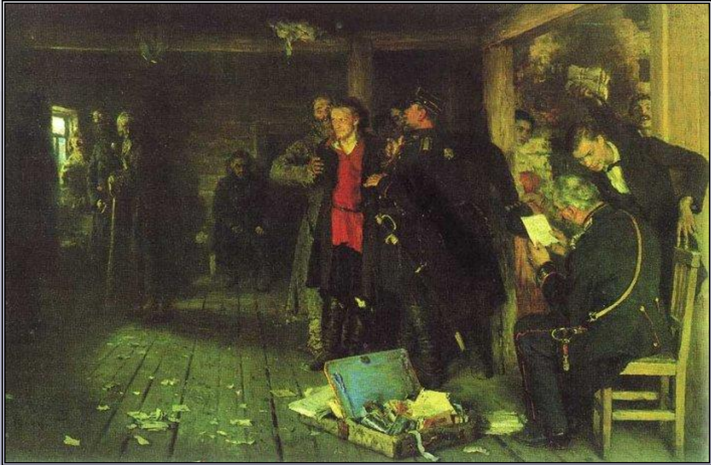
И.Е.Репин Арест пропагандиста

Чья позиция вам ближе: народников или крестьян ?