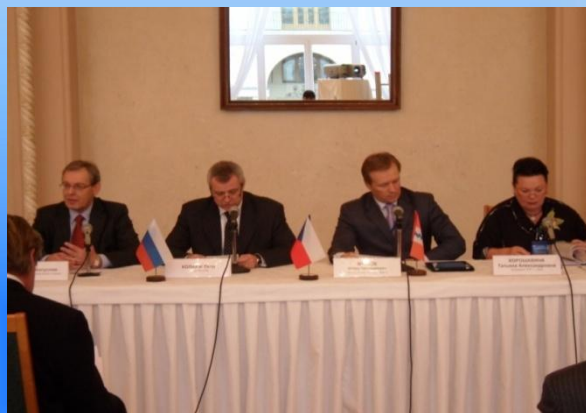
Презентация в Посольстве Чешской Республики, 2010 год