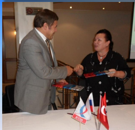
Презентация в Посольстве Турции, 2010 год