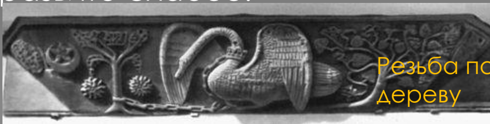
Резьба по дереву