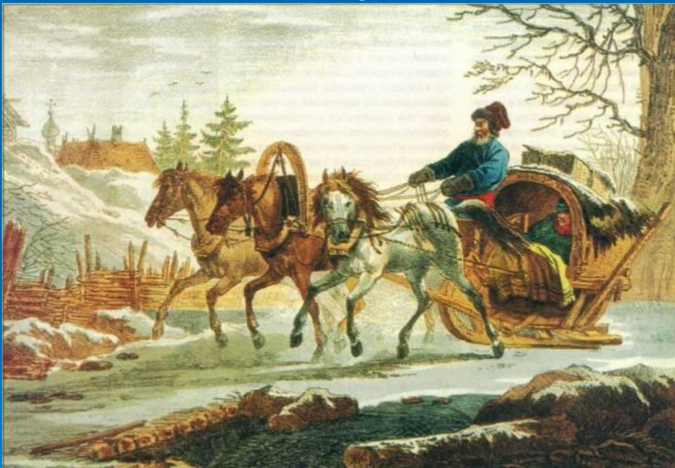
К. И. Кольман. Тройка. 1820-е гг.