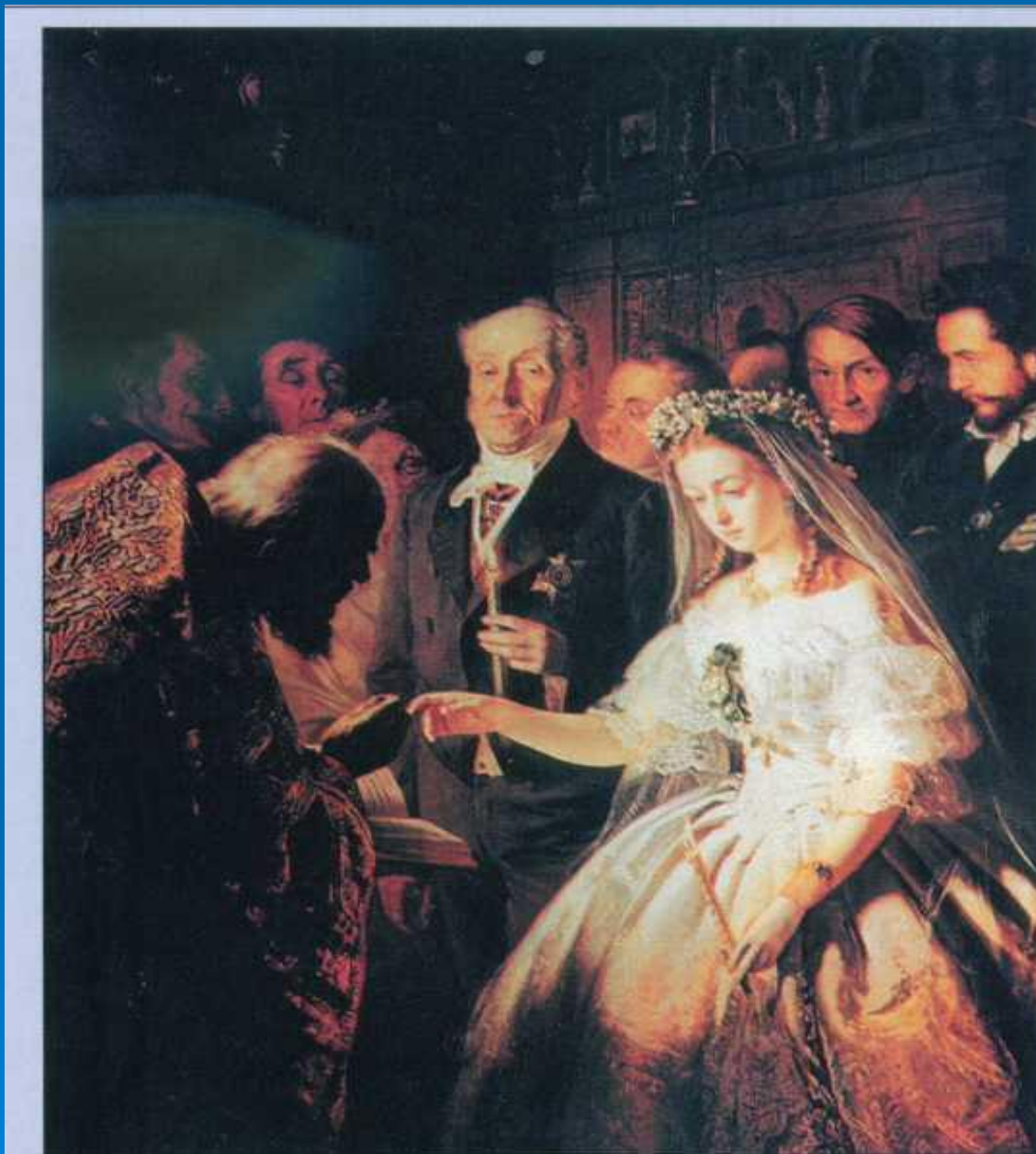
В.В.Пукирев. Неравный брак. 1862.