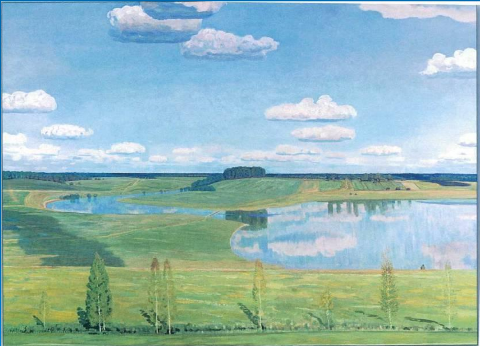
В.М.Сидоров. Тихая моя Родина. 1994