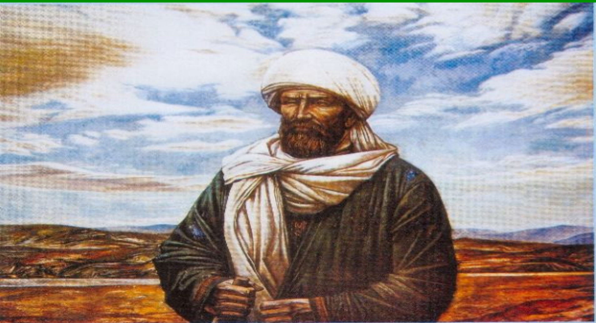
Акмулла, 1982 йыл