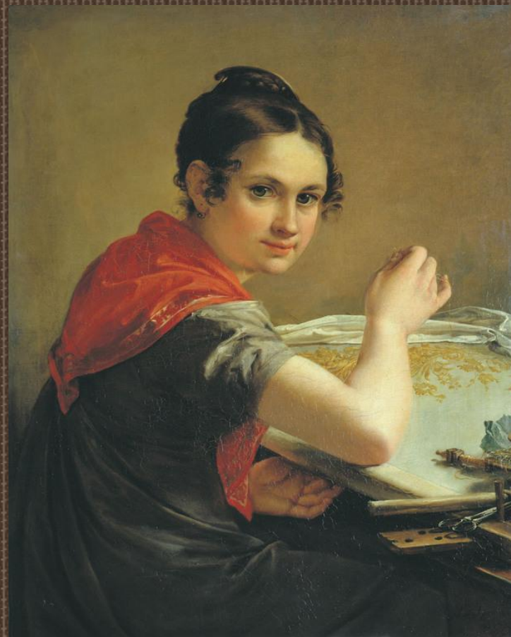
Василий Тропинин. Золотошвейка 1862 г.