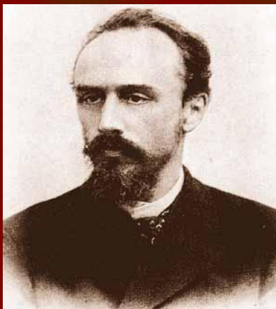
Александр Львович Блок, профессор Варшавского университета, отец поэта. Фотография. 1879г.