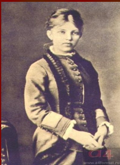
Александра Андреевна Блок, переводчица, мать поэта. Фотография. 1879г.