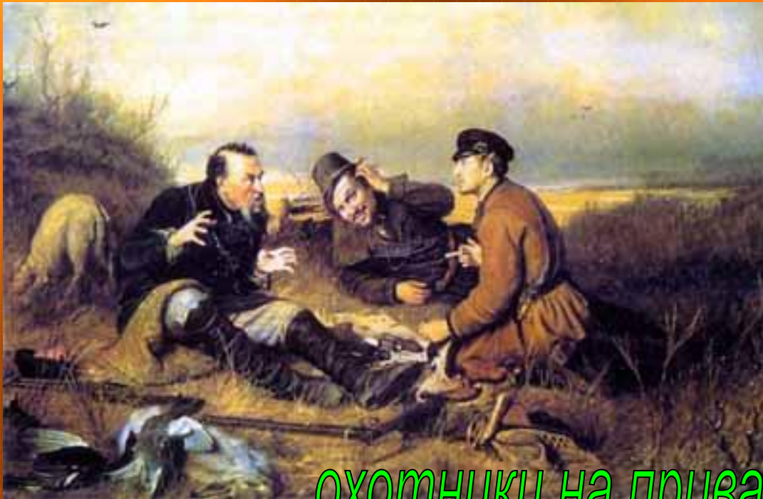
охотники на привале.