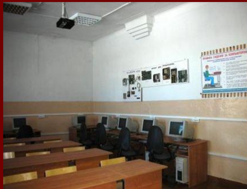
Кабинет «Оператор ЭВМ»