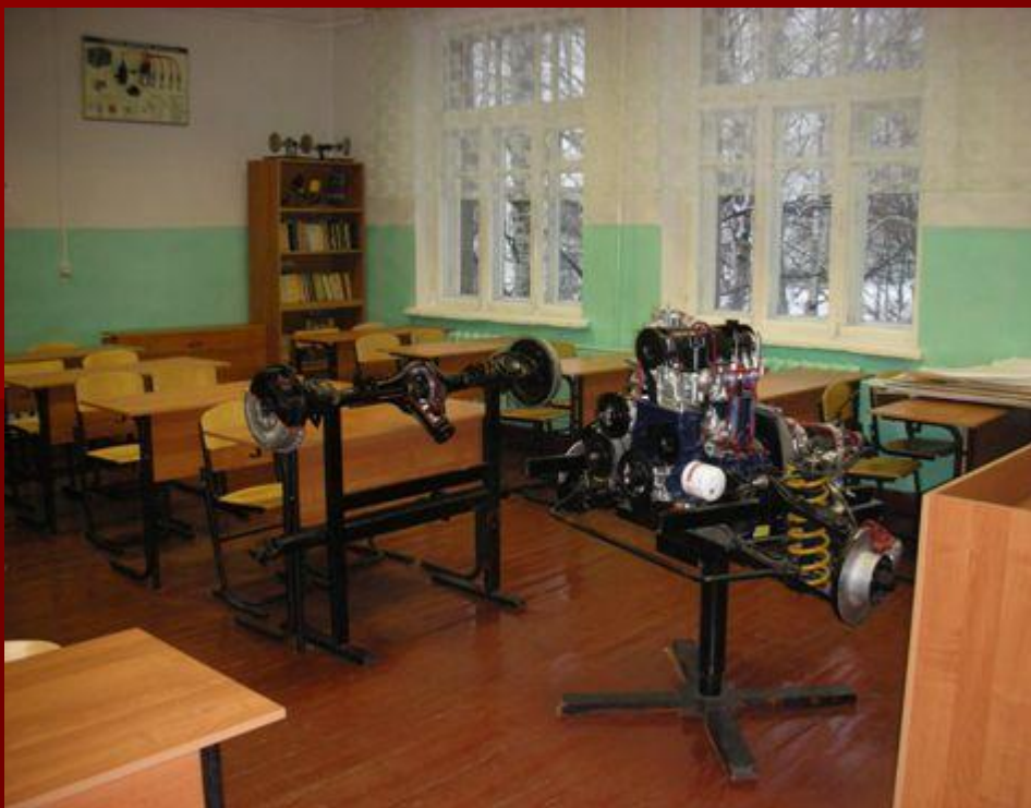
Кабинет «Слесарь по ремонту автомобиля»