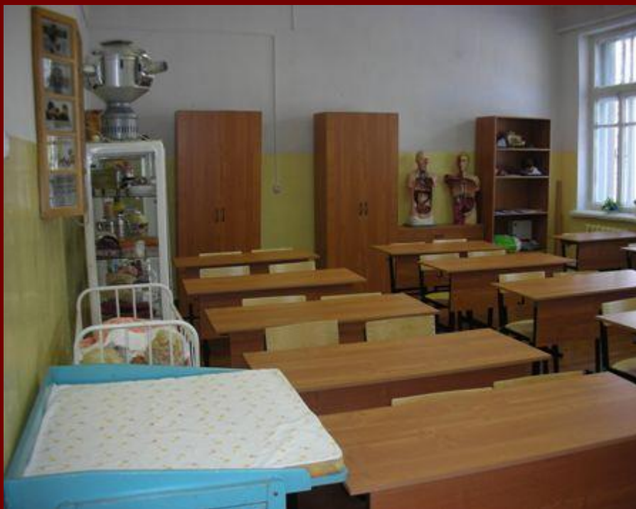
Кабинет «Медицинская подготовка»