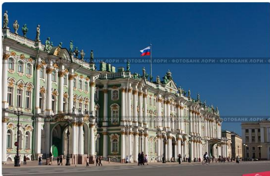
Государственный Музей Эрмитаж, Санкт-Петербург

На сегодняшний день для того, чтобы получить образование музейоведа, не обязательно ехать в Москву или в Санкт-Петербург.