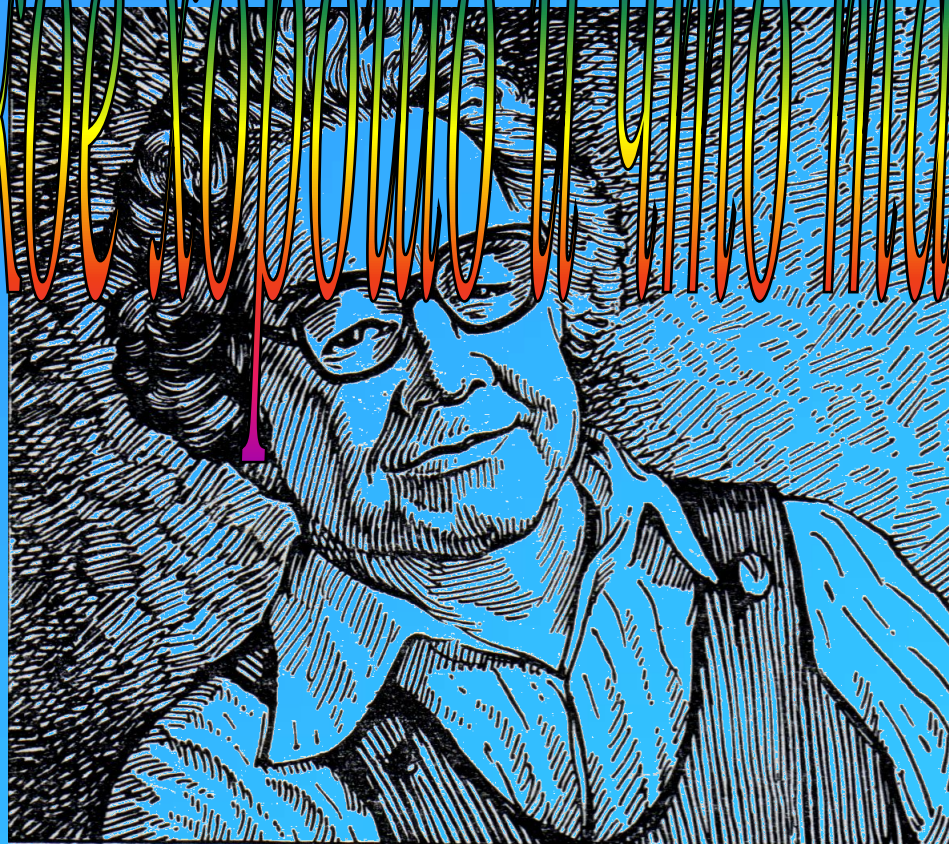
Пермяк Евгений Андреевич 1902 - 1982